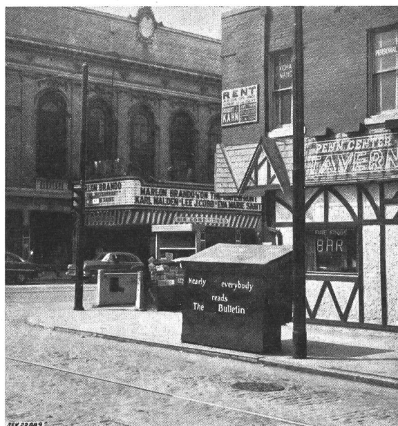
Fig. 3 In den Strassen Philadelphias trifft man auf Schritt und Tritt die Aufschrift: «Nearly everybody reads the Bulletin»

gemeine Zwecke wie Auskunft, Sekretariat, Reisebureau, Verpflegungsstätten bemerkenswerter Leistungsfähigkeit und Preiswürdigkeit, schliesslich die Studentenunterkünfte, die «dormitories» genannt werden. In der Schweiz würde man diese umfangreichen, in englischem Stil, aus gespendeten Geldern erbauten Unterkünfte als «Studentenbuden» bezeichnen. Diejenigen von Philadelphia sind in einzelne Häuser aufgeteilt, von denen jedes einen charakteristischen Namen trägt. Auch mit der Belegschaft aus relativ alten ausländischen Delegierten kam ein studentenähnlicher Betrieb mit abendlichen Budenbesuchen auf. Wie manchem mögen Erin-