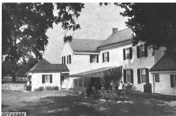
Fig. 2 Die Farm der Gastgeber Ashplund in Huntingdon Vallee

Die Commission Electrotechnique Internationale (CEI) beging am 9. September 1954 das Fest ihres 50jährigen Bestehens und dafür wählte sie die Stadt Philadelphia. Damit ist Philadelphia für manchen amerikanischen, aber insbesondere für die Delegierten der elektrotechnischen Fachwelt von ausserhalb des Nordamerikanischen Kontinents zu einem Begriff geworden. Das Wort Philadelphia hat für manchen den Sinn einer günstigen Verhandlungsatmosphäre und einer