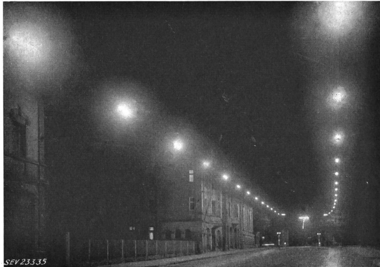
Fig. 2 Doppelreihige Längsanordnung von Leuchten mit Leuchtstofflampen 40 W

mässig geringer Lichtpunkthöhe die vertikale Beleuchtungsstärke auf die Objekte auf der Fahrbahn, auf Fahrzeuge und Personen, von ausserordentlich grosser Wichtigkeit ist. Aber es tritt dabei natürlich die Schwierigkeit auf, zu sagen, von welcher Seite die vertikale Beleuchtungsstärke gemessen werden soll. Das sind Dinge, die noch weiter untersucht werden, und die man wahrscheinlich auch in den noch erscheinenden ausführlicheren Leitsätzen irgendwie zum Ausdruck bringen wird.