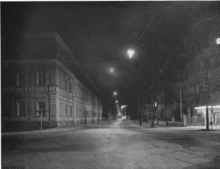
Fig. 3 Betonung einer Strassenkreuzung durch eine besondere Leuchtenform

Noch besser wird es sein, an einer Strasseneinmündung oder an einer Strassenkreuzung durch besondere Anordnung der Leuchten dafür zu