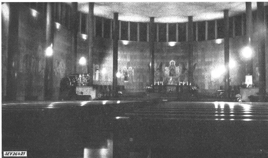
Fig. 3 St.-Karl-Kirche

Mit Baubeginn im Jahre 1940 wurde nach neuzeitlichen Prinzipien die St.-Joseph-Kirche gebaut.