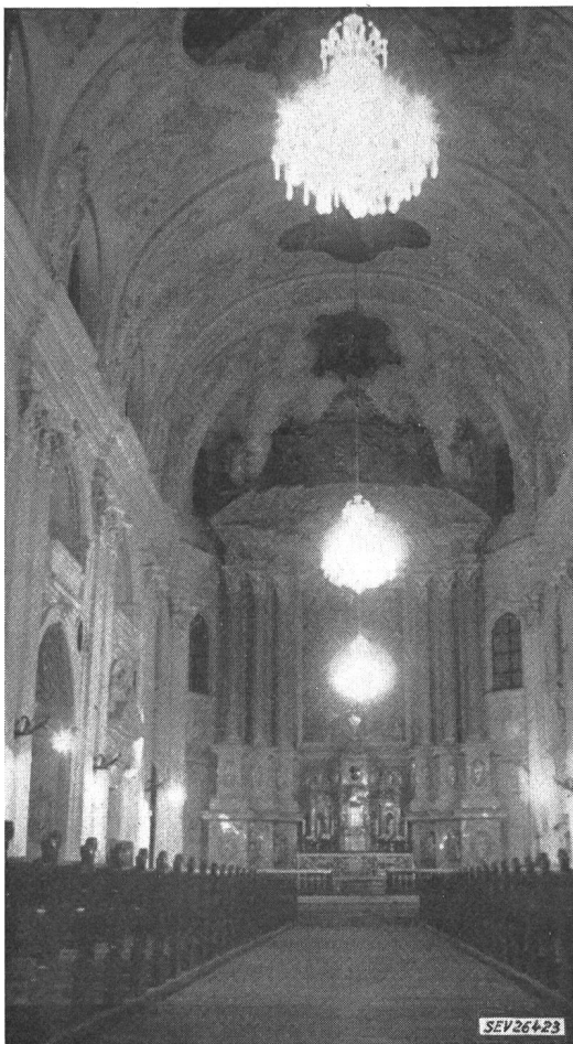
Fig. 5 Jesuiten-Kirche

zentrierten Lichtstromes zu drei Lichtschwerpunkten. Durch die Anordnung von drei Zierleuchten in der Kirchenachse (Stil Maria-Theresia von je 25 Stück 25-W-Lampen und einer 200-W-Lampe zur Deckenaufhellung, total 825 W je Leuchte) wurde die dekorative Seite der Beleuchtung besonders betont. Die Leuchten erfüllen damit die Aufgabe von schwachen Funktionslichtquellen. Die zusätzlichen 12 schmiedeeisernen Wandarme vervollständigen die Beleuchtungsanlage. Durch diese Beleuchtung bekommt man bei relativ kurzem Verweilen im Kirchenraum den Eindruck grosser Feierlichkeit. Die Lichtquellen und die Beleuchtungskörper sind vorherrschend. Leider ist eine Ablenkung durch grosse Leuchtdichten im Gesichtsfeld, mit Störung in Blickrichtung zum Altar, unvermeidlich. Die Lenkung des Lichtes ist nicht möglich, es bleibt vornehmlich in der Leuchtenebene; damit wird aber die Lesebeleuchtung ungenügend. Sie beträgt bei voller Beleuchtung im Mittel 15 lx, ohne Wandleuchten 12...13 lx. Der Beleuchtungswirkungsgrad ist niedrig.