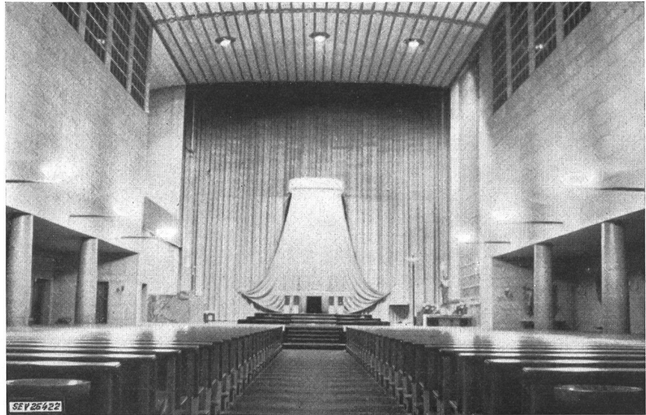
Fig. 4 St.-Josephs-Kirche

Bei der Verbesserung der Beleuchtung entschloss man sich zwecks Aufteilung des im Mittelschiff kon-