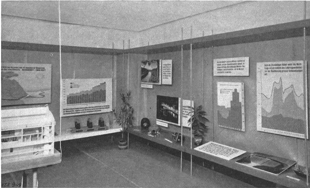
Fig. 1 Vue partielle de l'exposition

Sous la devise «De la roue hydraulique à l'usine atomique», cette exposition attira quotidiennement près de 4000 visiteurs. Groupée par sujets, elle embrassait, en dehors d'une série de graphiques et de photos reposant sur les données les plus récentes, des modèles d'usines et de leurs éléments, ainsi que des pièces historiques, parmi lesquelles on pouvait voir la