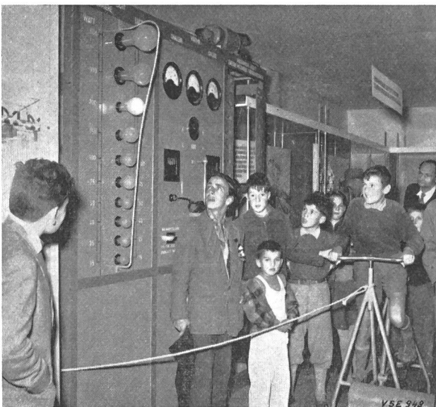
Fig. 2 Jeunes «producteurs d'énergie»

première dynamo construite par Bürgin et le premier compteur à courant alternatif de Borel.