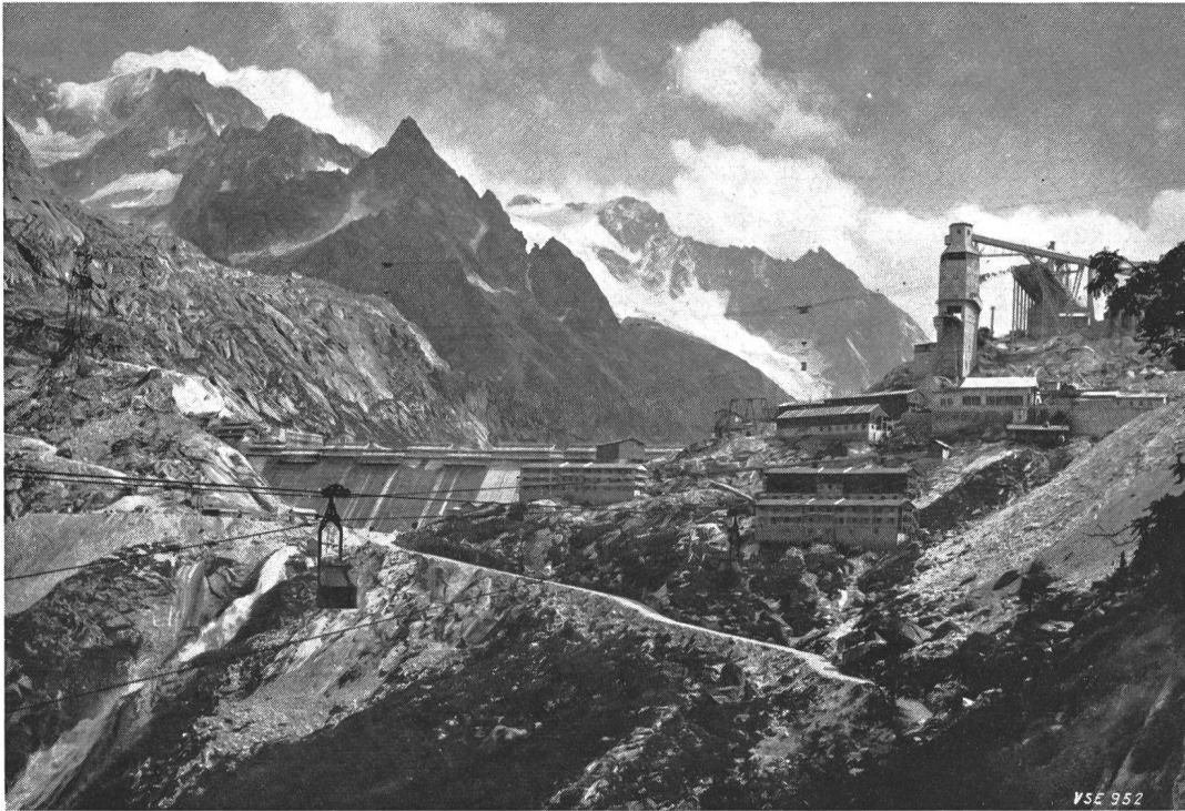
Fig. 1 Le barrage d'Albigna

l'eau de la région de Forno à la centrale de Löbbia, touchent à leur fin eux aussi.