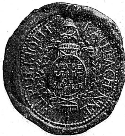
* Sceau de la République rauracienne

En janvier 1793, le 26, Goetschy est nommé député de la ville par quarante voix. Mais par suite d'une formalité que nous ne nous expliquons pas, il tire au sort avec Jacques Collon. Quelques jours plus tard, il demandait comme imprimeur national un bon de l'Assemblée pour toucher un acompte sur ce qui lui était dû; on le lui accorda. Enfin, nous lisons dans le registre des délibérations 1) : « L'imprimeur national est autorisé à faire faire des vignettes représentant les armes de la république d'après le modèle du sceau de la dite république pour l'usage de l'imprimerie nationale ».