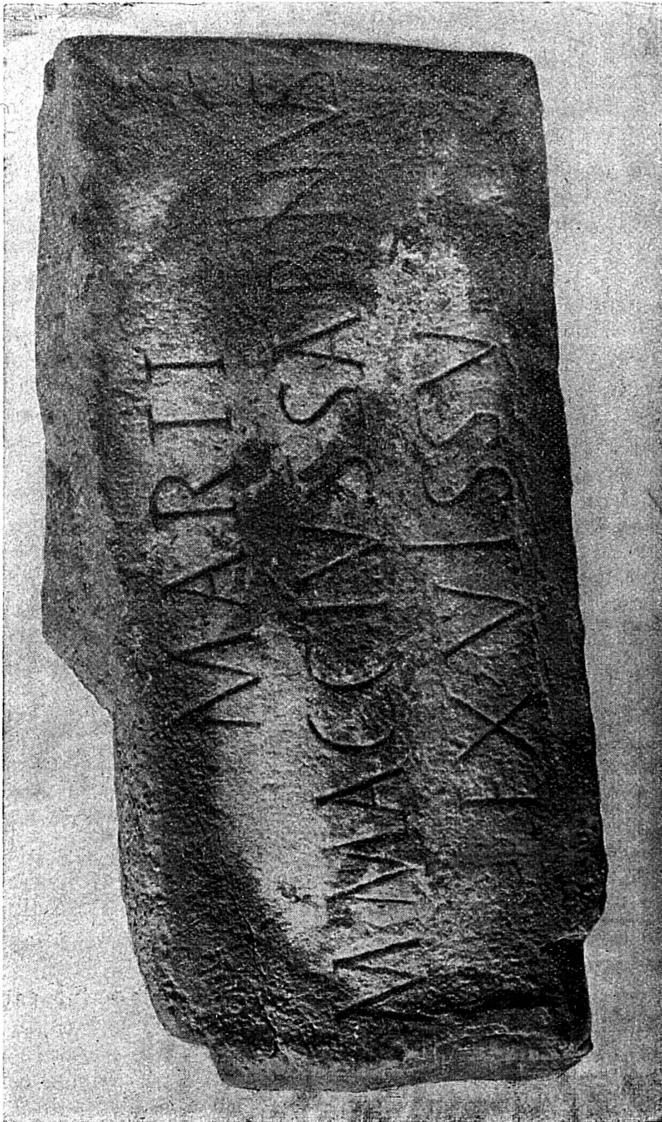
Table de Frinwillier

bords seuls en sont un peu ébréchés. La hauteur des lettres soigneusement taillées, quoique irrégulières, est de 4 cm. L'I de SABINVS est lié à l'N, de même que l'V à l'S.