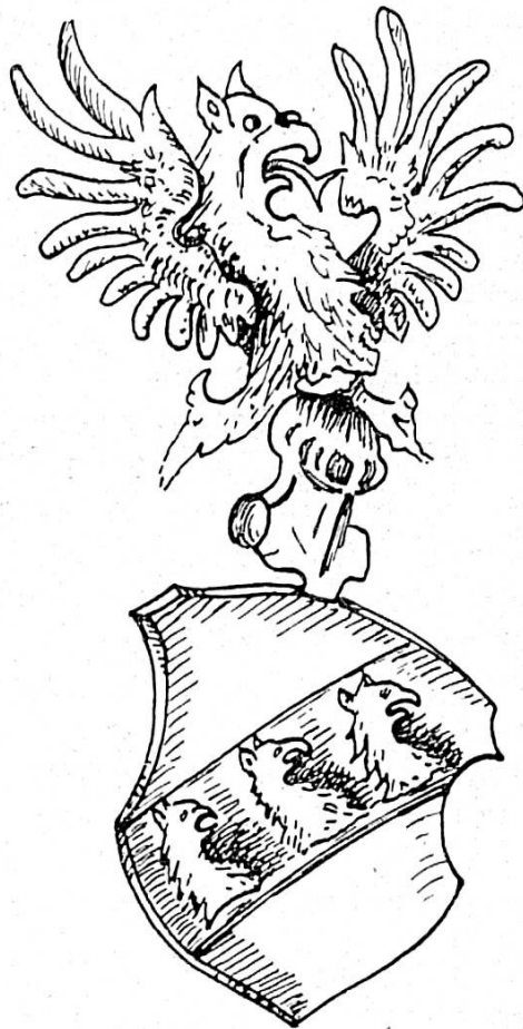
Fig. 3. Blason portant des griffons, attribué par erreur aux nobles de Porrentrut, d'après un ancien armorial de l'Evêché de Bâle

graphié: von Provoncourt 29 . Alors, il n'aura pas pensé à la petite localité de Bremoncourt et le nom, mal lu, fut interprété comme Porrentrut ou Prunentrut . Et si le peintre a représenté des griffons et non des dragons, c'est qu'il aura confondu ces deux animaux, car le cimier des Bremoncourt a des ailes d'oiseau et, logiquement... il fallait dessiner aussi un buste d'oiseau. Voilà ce qu'il arrive lorsque l'on veut corriger les anciens documents!