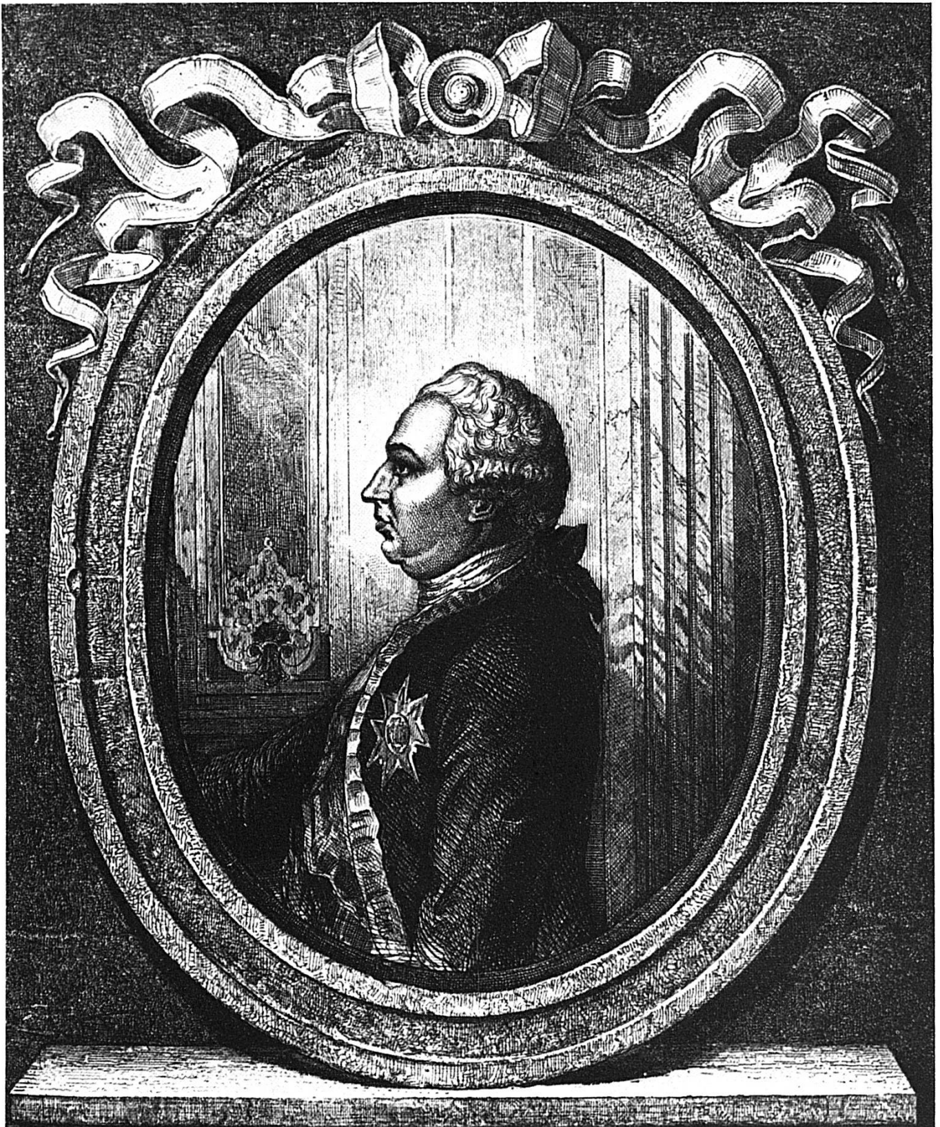
CHRÉTIEN-DAGOBERT-FRÉDÉRIC COMTE DE WALDNER LIEUTENANT-GÉNÉRAL