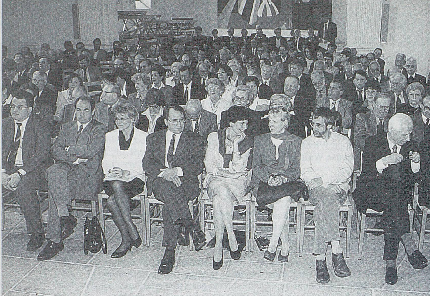
Assemblée générale du 26 avril 1997, à l'aula du Lycée cantonal, à Porrentruy.