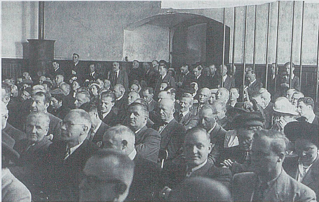
Vue de l'assemblée générale du centenaire, tenue le 27 septembre 1947 dans l'ancienne église des Jésuites, qui servait alors de halle de gymnastique de l'Ecole cantonale de Porrentruy.

politique » et « il n'est pas indiqué d'ouvrir une discussion sur la Question jurassienne » à cette occasion. Réunis par les festivités qui se tiennent à Porrentruy les 27 et 28 septembre 1947, les quelque trois cents membres issus des quatorze sections que l'Emulation comptait à l'époque assistent à bon nombre de discours et productions poétiques et lyriques à la gloire de la société centenaire.