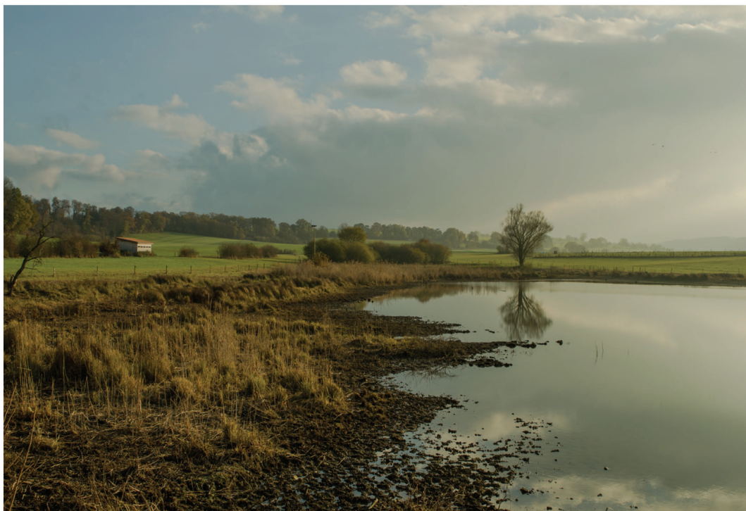
Fig. 17. Paysage montrant l'impact des sabots, les Cœudres, Damphreux, 2 décembre 2016.