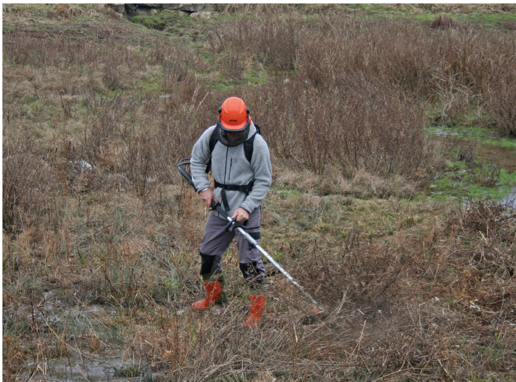
Fig. 5. Coupe à la débroussailleuse des végétaux envahissants, par un bénévole, dans un étang à sec aux Cœudres à Damphreux, 3 décembre 2016.