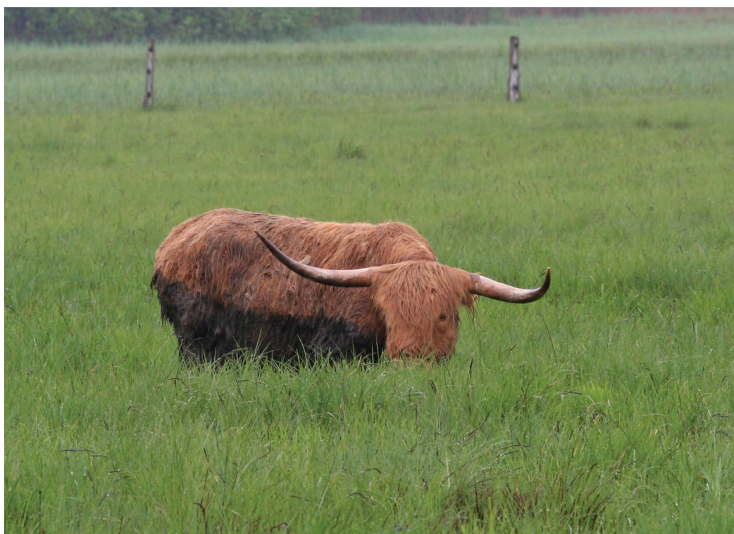
Fig. 9. Vaches écossaises Highland au Neeracherried (ZH), le 12 mai 2012.