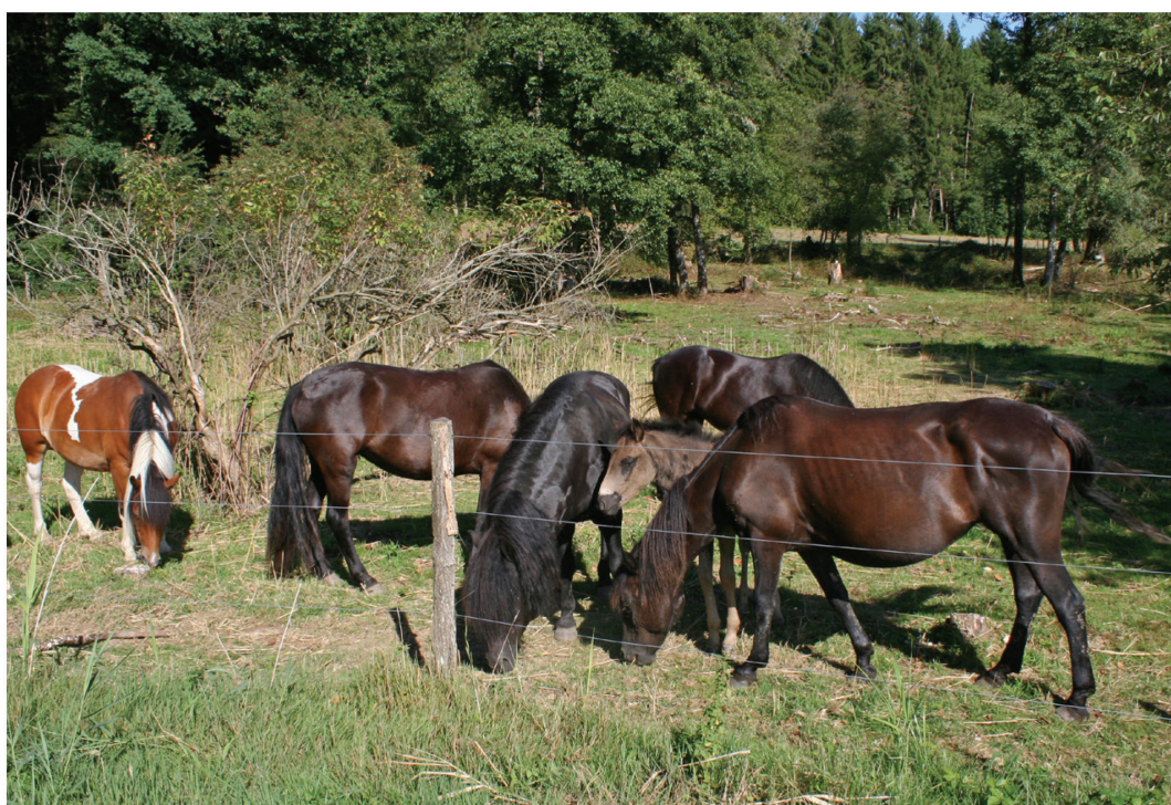
Fig.13. Les Pottok, derrière la clôture à trois fils, entretiennent le pâturage boisé, Bonfol, Queues-de-Chat, 6 août 2017.