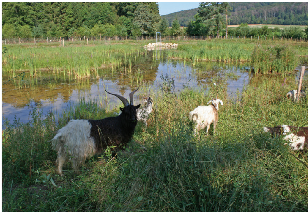
Fig. 14. Les Chèvres des Pyrénées pâturent les rives, Lugnez, étang de la Voivre, 24 juillet 2019.

Cette ouverture du milieu a facilité l'étude pour le lancement de la restauration des deux étangs situés en aval. Suite à la demande d'aide financière de la FMD auprès de l'État jurassien, le site a été reconnu, par l'Office de l'environnement et le Service des infrastructures (SIN), comme une compensation écologique du 3 e type suite à la construction de l'autoroute A16. Dans ce cadre, le bureau Biotec a établi les plans de la restauration et de la revitalisation. Dès la fin de l'été 2018 et jusqu'en 2019, d'importants travaux de curage des deux plans d'eau situés en aval ont eu lieu. La réfection des deux digues avec noyaux de béton maigre a été effectuée. Deux systèmes de vidange par batardeaux ont été mis en place. Des mares ont été creusées. La pâture n'a été pas interrompue et a pu se faire en fin d'été de 2018 à 2021. Dès le 1 er octobre 2021, avec la nouvelle répartition des terres du SAF de Bonfol, à la suite d'échanges de terrains, la parcelle FMD ne comporte plus de forêt.