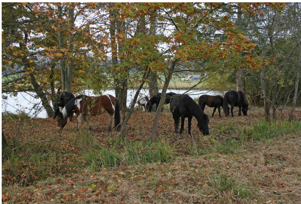
Fig. 7. Pottok dans un pâturage boisé en bordure d'étang aux Cœudres à Damphreux, 2 novembre 2016.