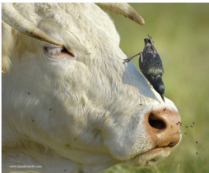
Fig. 2. Étourneau sansonnet Sturnus vulgaris , capturant les mouches sur le museau d'une vache.

du bétail. Parfois, l'étourneau se pose sur l'herbivore (fig. 2). Le bétail est débarrassé d'un certain nombre d'invertébrés gênants. L'oiseau profite des invertébrés qui pullulent dans l'entourage du grand végétarien. Dans ce mutualisme, entre le mammifère herbivore et l'oiseau, chacun profite de l'autre.