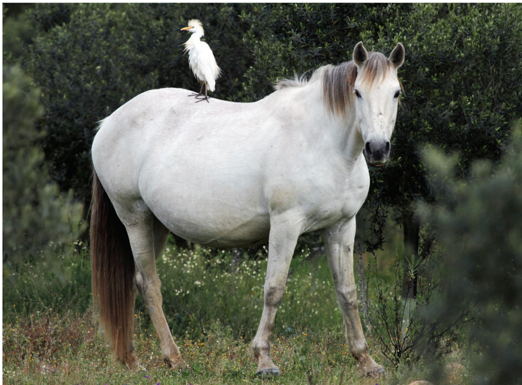
Fig. 1. Héron garde-bœufs Bubulcus ibis posé sur le dos d'un cheval, Huelva, Espagne, 21 mars 2015.

du bétail. Parfois, l'étourneau se pose sur l'herbivore (fig. 2). Le bétail est débarrassé d'un certain nombre d'invertébrés gênants. L'oiseau profite des invertébrés qui pullulent dans l'entourage du grand végétarien. Dans ce mutualisme, entre le mammifère herbivore et l'oiseau, chacun profite de l'autre.