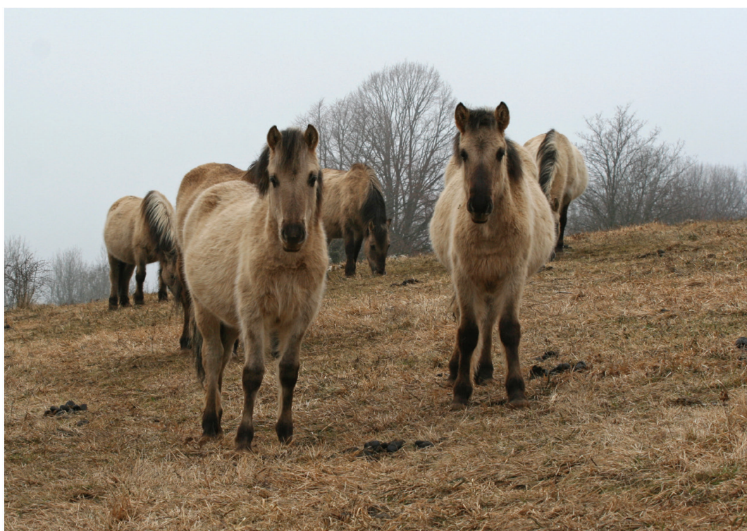
Fig. 8. Tarpans dans un pâturage maigre et sec près de Lons-le-Saunier F39, le 25 février 2012.