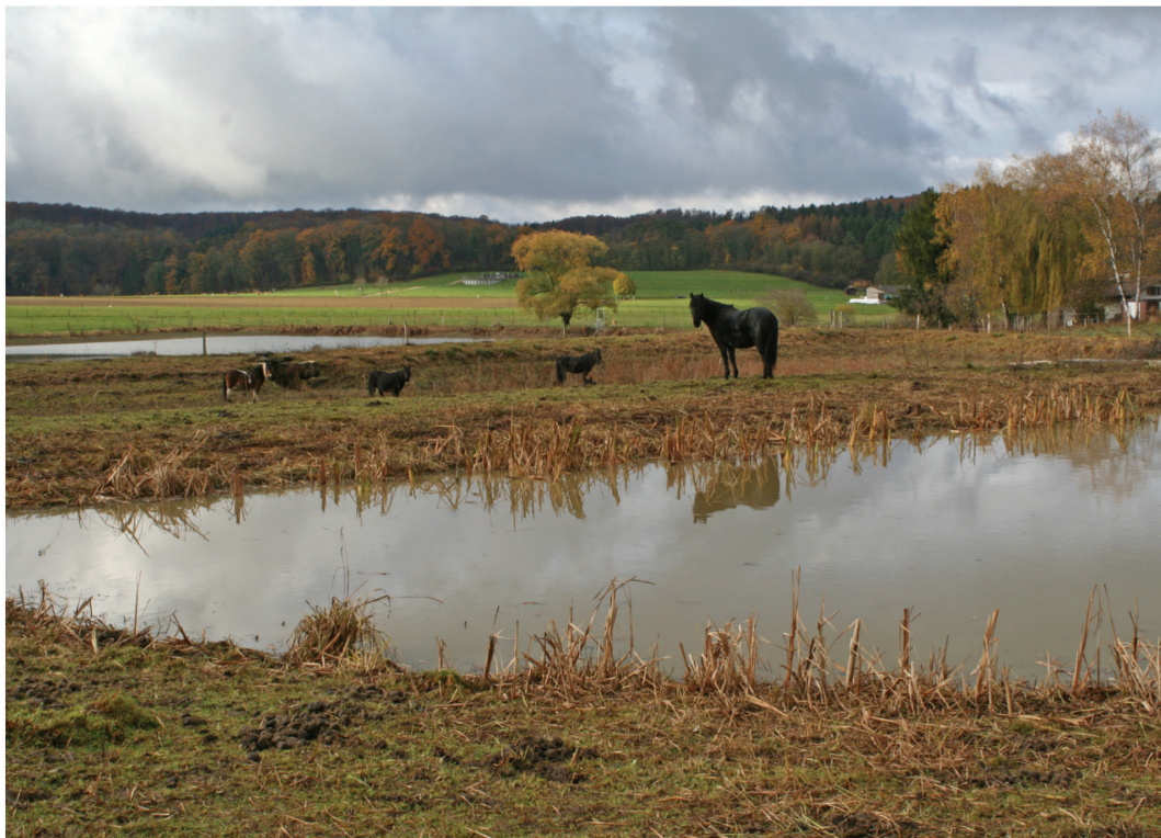
Fig. 16. Pâturage avec les Pottok, les Cœudres, Damphreux, 13 novembre 2017.