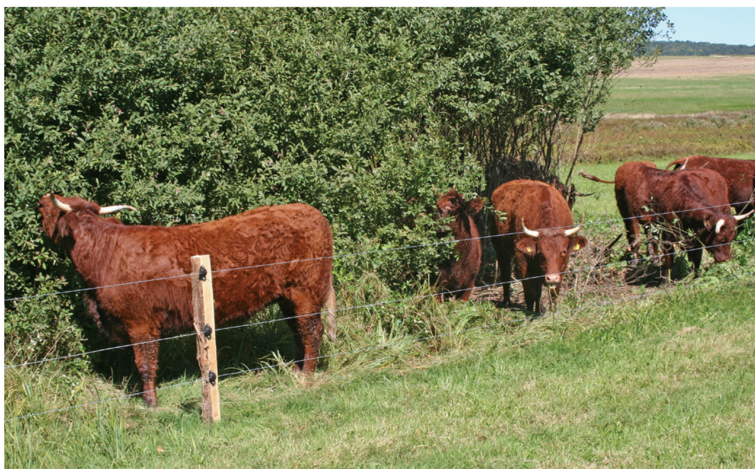
Fig.11. Les vaches Salers mangent aussi les feuilles de saules aux Cœudres à Dampheux, le 3.9.13.