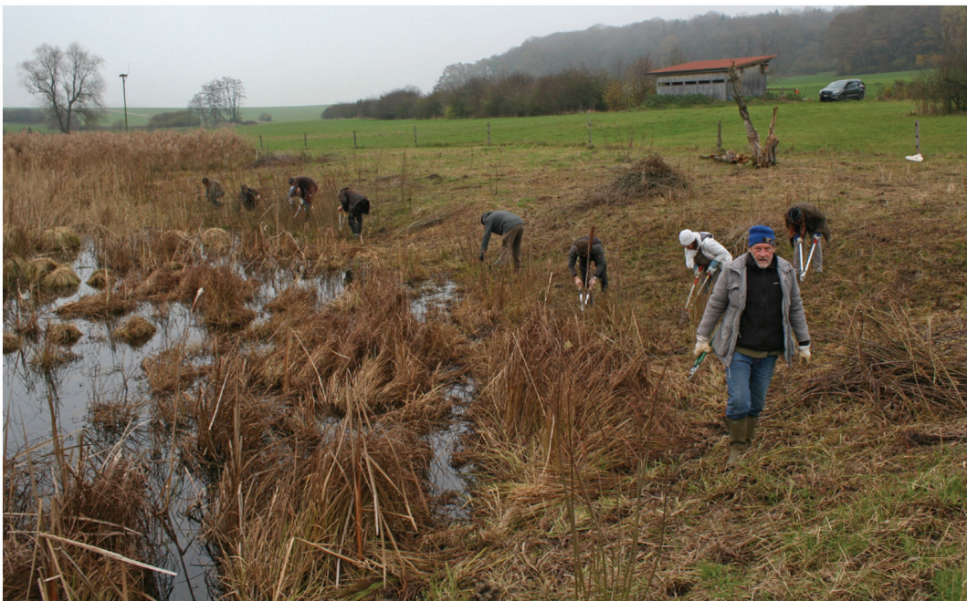
Fig. 15. Entretien annuel des rives d'étangs par des bénévoles, Damphreux, les Cœudres, 23 novembre 2019.

Les résultats que nous présentons sont provisoires. Ils sont comparés avec l'impact de la fauche par machines. Une contrainte de la pâture est à relever. L'éleveur n'a qu'un seul harem de Pottok et un