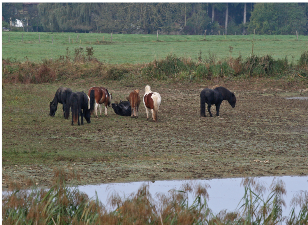
Fig. 6. Pâture aux Cœudres, à Damphreux, avec des Petits chevaux des Pyrénées ou Pottok, 5.10.2014.

Dès l'automne 2012, en s'inspirant de pratiques utilisées ailleurs avec succès, l'expérience d'entretien des marais par pâture, a débuté d'abord aux Cœudres, sur certaines surfaces, avec des herbivores rustiques (fig. 6). En raison des bons résultats observés, cette pratique a été étendue à Bonfol en 2015 et à Lugnez en 2019.