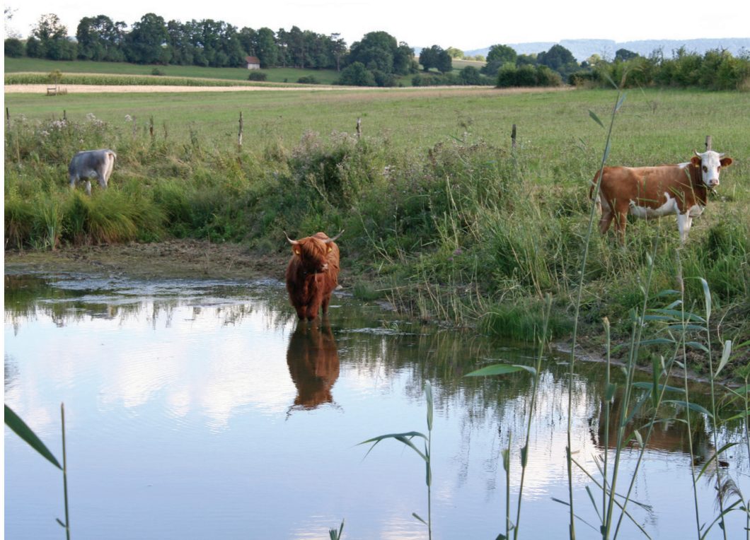
Fig. 10. Petites vaches : Grise Rhétique, Highland et Hinterwald pâturent en bordure d'étang aux Cœudres, août 2017.