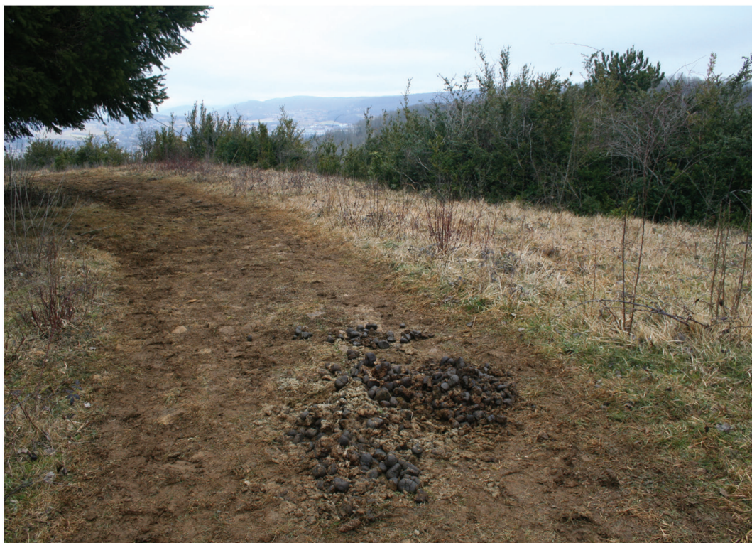
Fig. 18. L'étaalon dépose souvent son crottin au même endroit, pour marquer son territoire. Ces excréments, encore riches en fibres végétales, sont bourrés d'insectes coprophages, Lons-le-Saunier 25 février 2012.