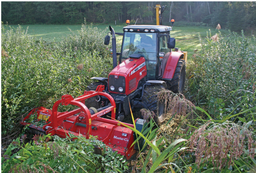
Fig. 4. Intervention mécanisée de fauche, en bordure d'étang, aux Queues-de-Chat, à Bonfol, 17 septembre 2014.