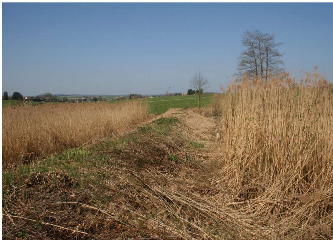
Fig.12. Digue fauchée avant la mise en place d'une clôture, Bonfol, Queues-de-Chat, 24 avril 2010.