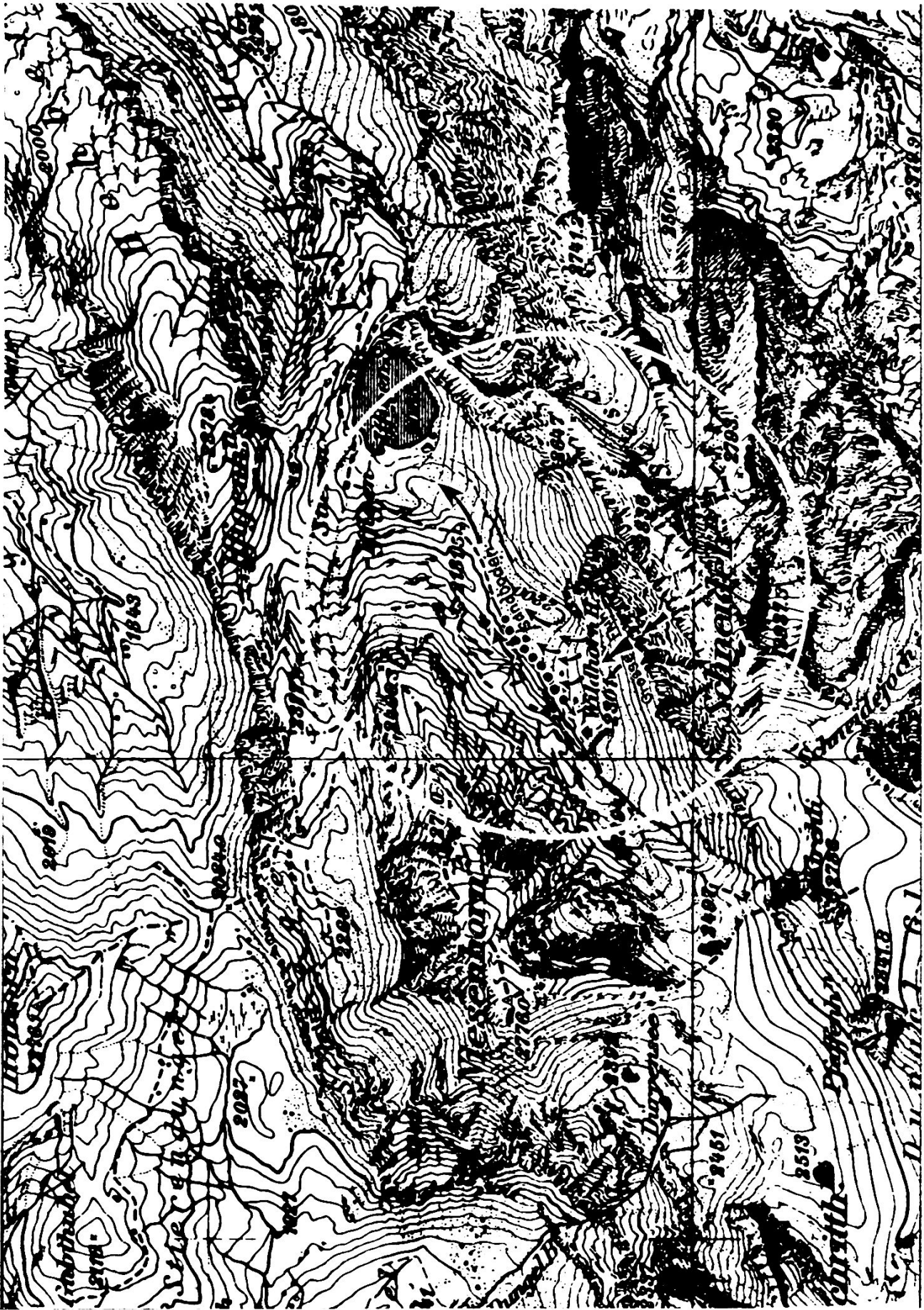
Gebiet der Wildhornhütte.