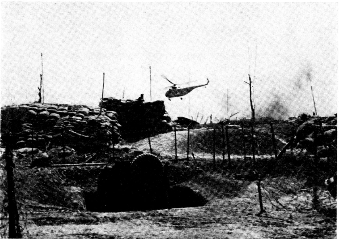
L'hélicoptère sanitaire en vol. Des abris d'où émergent des antennes sont puissamment protégés; la jeep est en partie entrée en terre.