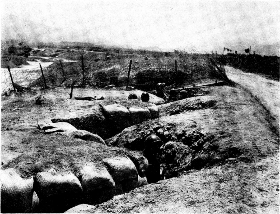
Détails de l'organisation défensive à proximité de la rivière Nam-Youm, qui traverse le camp. Un abri et un boyau en zigzag.