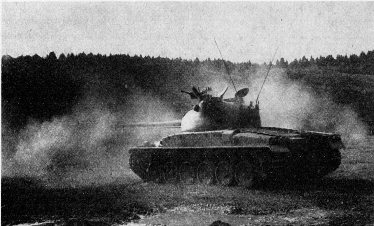
Bild 3. Pz. 58 beim Schießen

Es liegt in der Natur der Sache, daß bei Prüfstandsversuchen die tatsächlichen Einsatzverhältnisse nicht immer, oder dann nur mit sehr großem Aufwand, reproduzierbar sind, so daß sich die abschließenden Erkenntnisse nur durch Versuche am Gesamtobjekt gewinnen lassen. Die Fahr- und Schießversuche mit dem ganzen Panzer haben in der Folge die Richtigkeit des schrittweisen Vorgehens erwiesen. Wenn sich auch infolge der gegenseitigen Beeinflussung der verschiedenen an sich genügenden Elemente gewisse Mängel zeigten und neue Teillösungen erforderten, so waren doch weder für die Konzeption noch für die einzelnen Baugruppen grundsätzliche Änderungen notwendig.