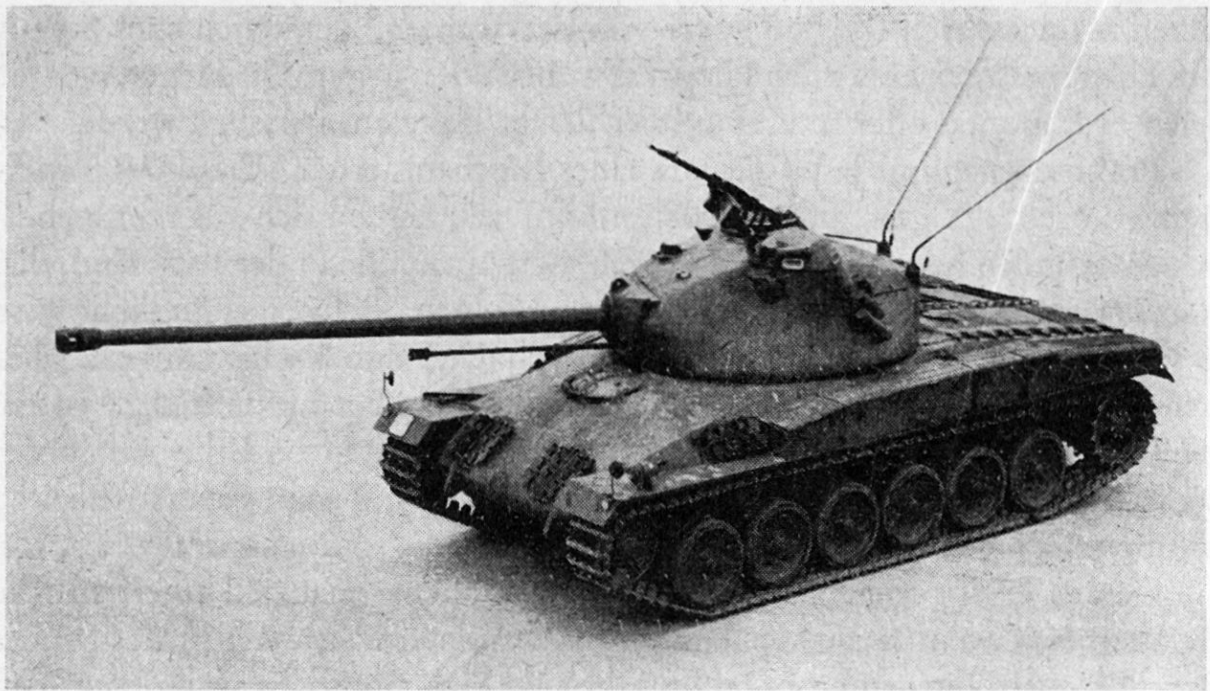
Bild 1. Prototyp des schweizerischen mittelschweren Kampfpanzers Pz. 58.