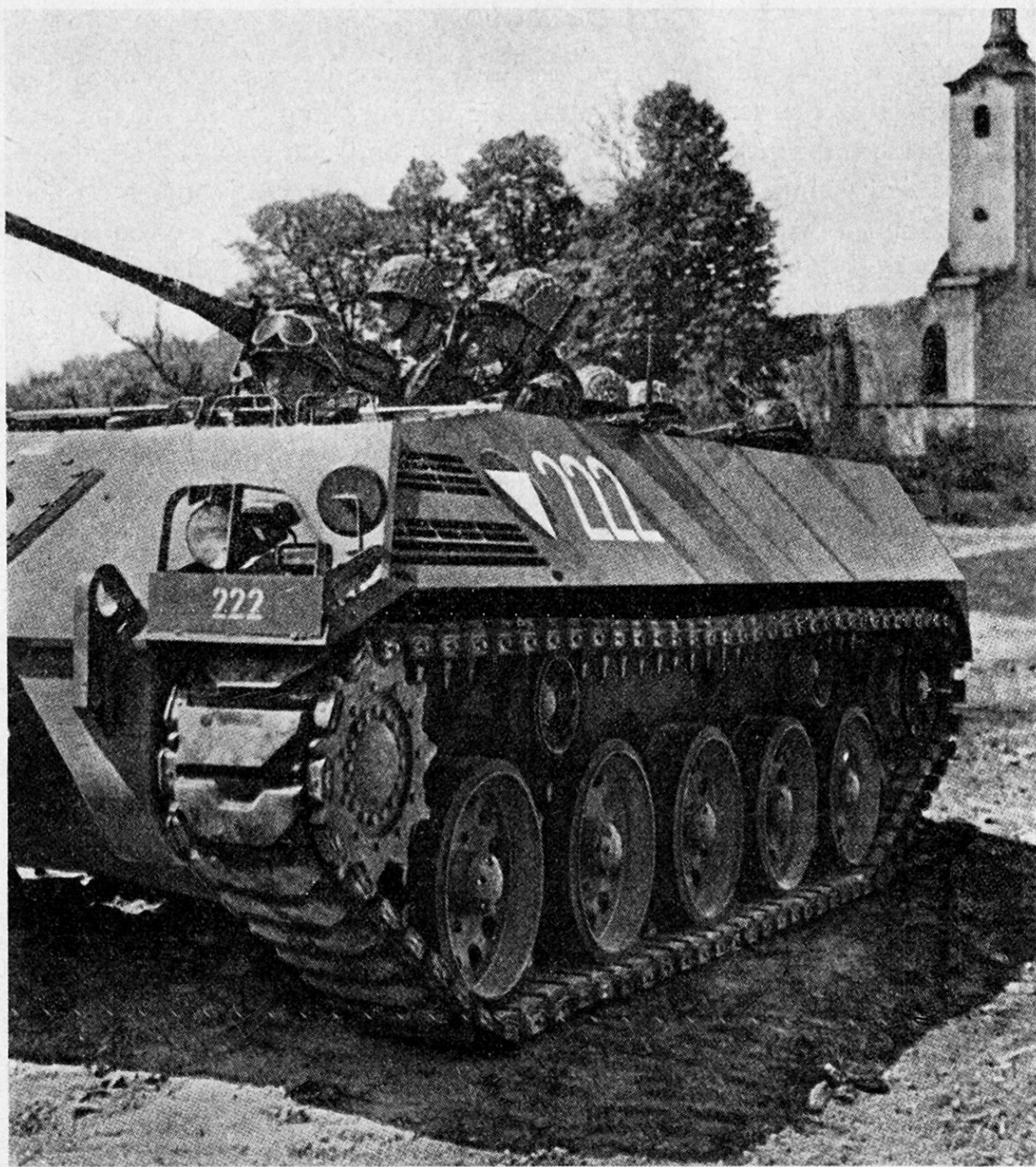
Bild 4. Saurer-Schützenpanzerwagen des österreichischen Bundesheeres

Das Entscheidende bei der Wahl einer Waffe ist aber die Frage nach dem Zweck. Je nach der zu lösenden Hauptaufgabe wird die Waffe anders aussehen müssen, nämlich