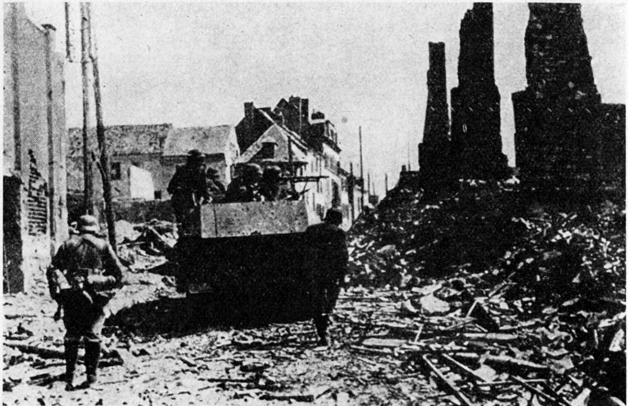
Bild 3. Panzergrenadiere im Ortskampf

Der Kampf der Panzergrenadiere charakterisiert sich durch den ständigen Wechsel je nach Lage zwischen aufgesessenem und abgesehenem Kampf. Die Möglichkeit, das Fahrzeug rasch verlassen und rasch wieder besteigen zu können, ist deshalb neben der Hauptforderung nach guter Kampfmöglichkeit vom Fahrzeug aus von großer Wichtigkeit.