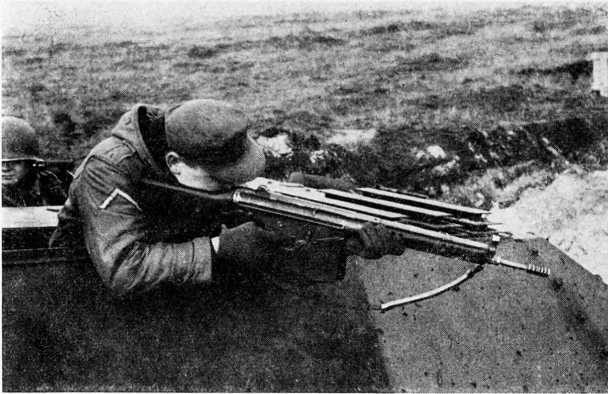
Bild 2. Aufgesessener Kampf des Panzergrenadiers

Wie kann das Risiko, einen Treffer zu erhalten, verkleinert werden?