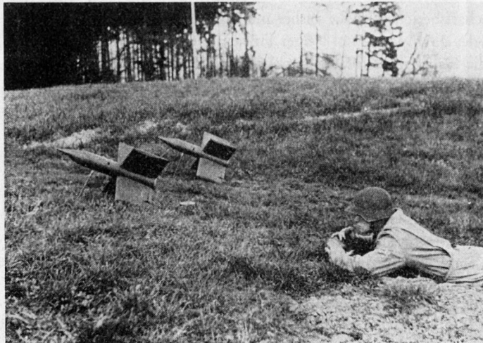
Bild 1 Panzerabwehr-Lenk Waffe «Mosquito» schußbereit ab Boden (Tarnung weggelassen)

Ähnlich wie bei Handgranaten, Gewehrgranaten, Minenwerfern und Geschützen die technische Reichweite den taktischen Einsatz