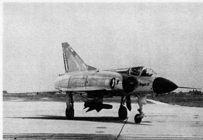
Mirage III, zum Luftkampf ausgerüstet mit 2 Kanonen 30 mm und 250 Schuß, 1 Lenkgeschöß Matra 530 mit Infrarot- oder Radarsuchkopf

Die Weiterentwicklung der Waffe führt zu größeren Reichweiten und zum Atomsprengkopf mit einigen 100 Metern Wirkungsradius. Damit soll nicht nur das Flugzeug zum Absturz gebracht, sondern auch die mitgeführte Atomwaffe in der Luft unschädlich gemacht werden. Es kann angenommen werden, daß die weitere Entwicklung bemannter Waffensysteme nicht auf der Leistungssteigerung des Flugzeuges, sondern der Bordelektronik und der Lenkwaffe beruhen wird. Letztere wird immer mehr zur zweiten Stufe eines Waffensystems, die durch eine bemannte erste Stufe in eine günstige Abschubposition an den Gegner gebracht wird.