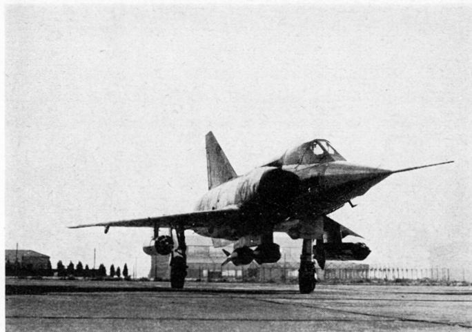
Mirage III, zum Erdkampf ausgerüstet mit 2 Kanonen 30 mm und 250 Schuß, 2 Sprengbomben zu je 400 kg, 2 Behältern mit je 18 Raketen 68 mm und 250 l Petrol im hintern Teil

Die Sprengbomben bilden immer noch das stärkste Zerstörungsmittel mit konventionellem Sprengstoff. Das Kaliber von 400 bis 500 kg, wovon zirka 50 Prozent Sprengstoff, hat sich allgemein durchgesetzt. Es wird mit guter Wirkung gegen Bauten, Brücken, Straßenengnisse, Kommandoposten, Pisten und ähnliche Ziele eingesetzt. Der Munitions-Aufwand ist sehr stark von der Abwurf-Technik abhängig, die ihrerseits durch die Wahl der Zünder mitbestimmt wird. Bei den erwähnten Zielen ist meistens der Verzögerungszünder zweckmäßig, der ohne Gefährdung des Flugzeuges eine kleine Abwurfdistanz erlaubt und damit gute Präzision ergibt.