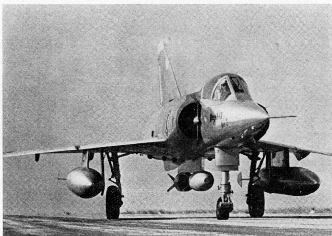
Mirage III, zum Erdkampf ausgerüstet mit 2 Kanonen 30 mm und 250 Schuß, 2 Sprengbomben von je 400 kg, 2 Zusatzbehältern für Treibstoff (oder Feuerbomben) von 820 l

Diese Waffen eignen sich hauptsächlich für die Bekämpfung von Punktzielen größerer Bedeutung – angesichts des erheb-