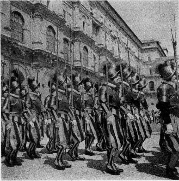
Abzug der Schweizergarde nach der Vereidigung im Belvedere-Hof des Vatikans

dem Verfasser zu. Der andere thematische Vorzug liegt in der Sache selber, indem eine umfassende Geschichte der Schweizer Söldner immer auch eine solche ihres Brotherrn sein, diejenige der Schweizergarde in Rom also immer auch das Papsttum, damit Italien und gelegentlich sogar die gesamte europäische Staatenwelt im Auge behalten muß. Die äußere Geschichte der Garde wickelt sich also vor der großartig bewegten Szenerie der großen europäischen Geschichte ab. Beim Sacco di Roma (1527) starb die noch junge Garde den Heldentod und stand damit keineswegs hinter den Schweizer Söldnern von Bicocca und Pavia zurück, die im gleichen Jahrzehnt für den französischen König fielen. Beim Einmarsch der Franzosen (1798) starb sie dann allerdings nicht mehr, sondern zog sich ohne Aufwand und Umstände aus der Affäre; doch ist man dem Vernehmen nach damals ja auch in der Schweiz nicht mehr so ohne weiteres zum Sterben bereit gewesen. Napoleon spielte auch mit der Garde, wie er mit ganz Europa spielte, solange sich Europa dieses Spiel gefallen ließ. Das europäische Sturmjahr 1848 brachte mit