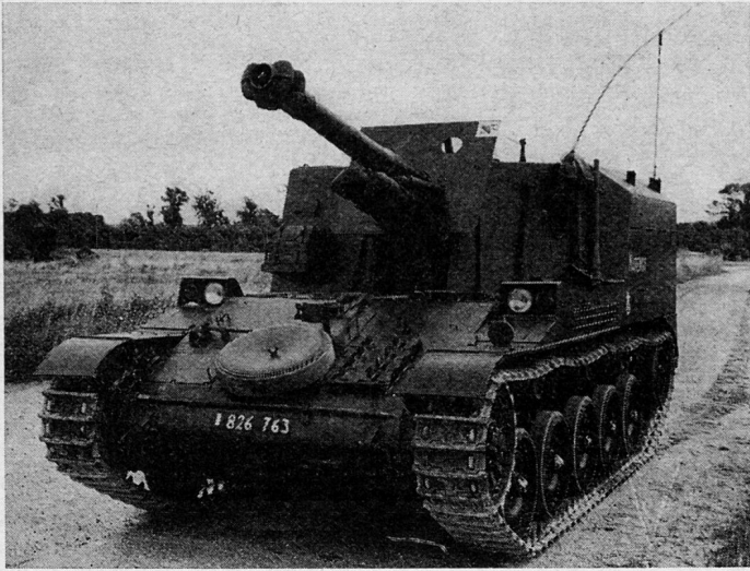
Frühes Modell der Selbstfahrraubitze, in dem der Kampfraum nicht als drehbarer Turm konstruiert ist

Die Streitkräfte aller Staaten werden gegenwärtig einer besonders tiefgreifenden Umgestaltung unterzogen. Beweglichkeit und Feuerkraft stehen dabei im Vordergrund der Bestrebungen zur Modernisierung.