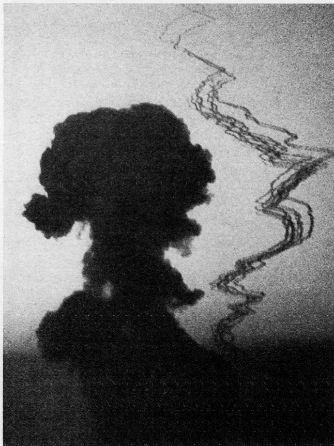
Reggane, 3e explosion. Formation du champignon avec stries fumigènes pour l'étude de la propagation de l'onde de choc

On peut admettre, également d'une manière très approximative, que l'industrie atomique en fonctionnement (plutonium) peut donc produire la matière fissible nécessaire à la fabrication d'une dizaine de bombes pour le moins par an. Les masses critiques réalisant l'explosion par la réunion de leurs deux demi-parties, normalement séparées, qui dépassaient la dizaine de kilogrammes, ont pu être ramenées, semble-t-il, à près de la moitié, notamment par une meilleure enveloppe réfléchissant les neutrons vers l'intérieur du dispositif, par les opérations de la mise à feu faites sous vide et l'emploi d'un amorçage au gaz, celui-ci provenant des galeries de mines d'uranium. Les possibilités de production vont être augmentées par la nouvelle usine de Cherbourg, sans compter la future usine de Pierrelatte. Du niveau de dizaines, la France passera à celui de la centaine, puis probablement des centaines, de bombes en stock, dont celles de très haute puissance. Mais cela