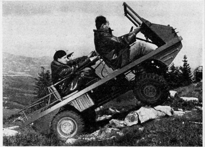
Geländelastwagen Haflinger bei Steigversuchen im Gelände. Für den Einsatz in der Armee dürfen keine Personen auf der Ladebrücke transportiert werden

Der Fahrer bedient das vollsynchronisierte Fünfganggetriebe mit einem normalen Schalthebel. Die Einscheibenkupplung wird durch Pedal betätigt, ebenso die hydraulische Vierradtrommelbremse. Der Vorderradantrieb kann während der Fahrt ein- und ausgeschaltet werden. Sowohl die Vorderräder wie auch die Hinterräder sind je mit einem Sperrdifferential versehen, die während der Fahrt einzeln eingeschaltet werden können. Der erste Getriebegang ist als Kriechgang ausgebildet und gestattet eine Mindestgeschwindigkeit von 2,5 km/h, so daß das Fahrzeug auch an Steigungen im Fußmarsch begleitet werden kann. Andererseits erlaubt die Höchstgeschwindigkeit von 60 km/h im fünften Gang das Halten des Tempos von flüssig fahrenden Kolonnen von leichten Geländelastwagen. Die weiche Federung besteht aus Schraubenfedern und zusätzlichen, progressiv wirkenden Gummihohlfedern.