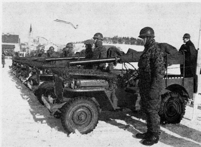
Abb. 1. rsf.Pak-Zug einer Grenzschutzeinheit.

Um eine finanzielle Belastung der Reservisten zu vermeiden, steht diesen für nachgewiesenen Erwerbsentgang eine Entschädigung bis zu sFr. 25.- täglich zu. Fahrtkosten werden vergütet, Unterkunft und Verpflegung sind frei. Studenten erhalten keine Entschädigung.