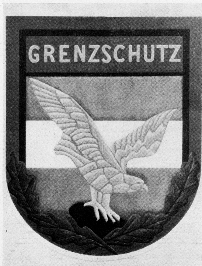
Abb. 2. Das Abzeichen des österreichischen Grenzschutzes.