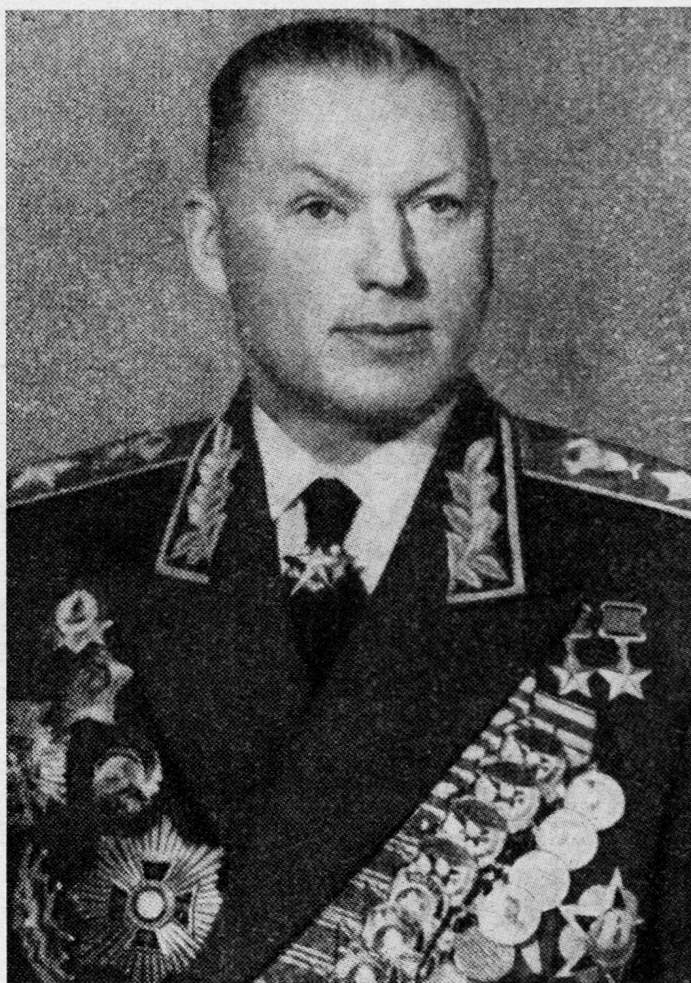
Bild 6. Marschall Konstantin Konstantinowitsch Rokossowskij, Kommandant der 1. und 2. weißbrussischen Front, «Spion Pilsudskis». (*1896.) Nach Haftentlassung an die Front.

2. Freiheitsentzug: Zulässig für die Dauer von höchstens 10 Jahren, bei besonders schweren Verbrechen von höchstens 15 Jahren. Verbüßung in einer Besserungsarbeitskolonie oder im Gefängnis, Minderjährige in einer Arbeitskolonie für Minderjährige. Freiheitsentzug in Form der Gefängnishaft kann gegen Personen, die schwere Verbrechen begangen haben, gegen gefährliche Rückfalltäter sowie gegen Personen, welche die in der Besserungsarbeitskolonie eingeführte Ordnung verletzen, durch das Gericht verhängt werden.