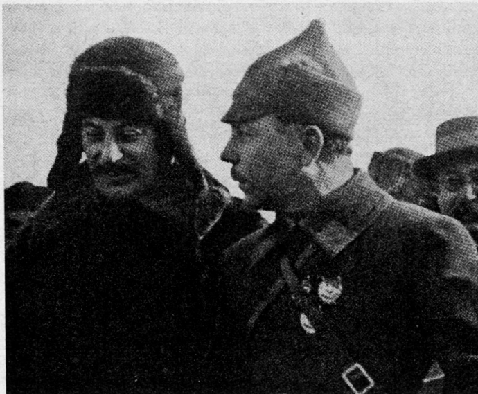
Bild 4. Säuberer Stalin über Tuchatschewskij: «Ein Schurke und ein Prostituiertes.» Dazu Woroschilow: «Eine sehr zutreffende Charakterisierung.»

Das Gesetz sieht ein unterschiedliches Strafmaß bei Gehorsamsverweigerung vor: in Friedenszeiten Freiheitsentzug von 1 bis zu 10 Jahren, in Kriegszeiten oder im Verlauf von Kampf-