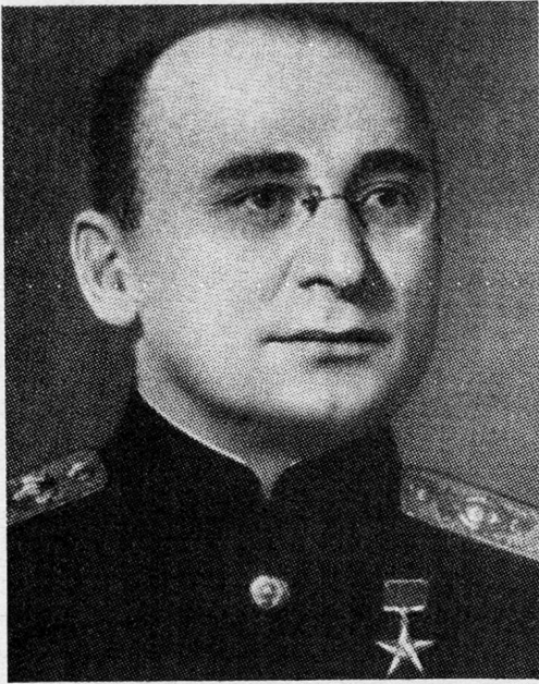
Bild 10. Lawrentij Pawlowitsch Berija, Chef der NKWD von 1938 bis 1953. (1899–1953.)