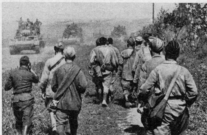
Bild 8. Sowjetische Kriegsgefangene: «Landesverräter», aus Himmlers Konzentrationslager nach Hause direkt in Berijas Todesgarten.

Die eigentliche Rehabilitierung der von Stalin liquidierten Führer der Roten Armee nahm am 25. Februar 1956 ihren Anfang, als nämlich Chruschtschew in seiner berühmten Geheimrede vor dem XX. Parteitag zu den Säuberungen im Offizierskorps Stellung nahm und nach der Schilderung der Terrormaßnahmen verkündete, daß «... der Militärsenat des Obersten Sowjets seit 1954 7679 Personen rehabilitiert hat, die zum Teil erst nach ihrem Tode rehabilitiert werden konnten». [29]