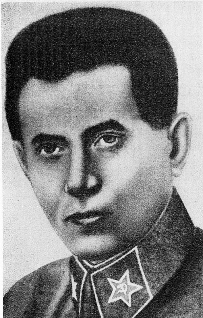
Bild 7. Nikolaj Iwanowitsch Jeschow, Generalkommissar für Staatssicherheit (NKWD).

steriums für öffentliche Sicherheit im Unteroffizier- oder Mannschaftsbestand verübt werden;