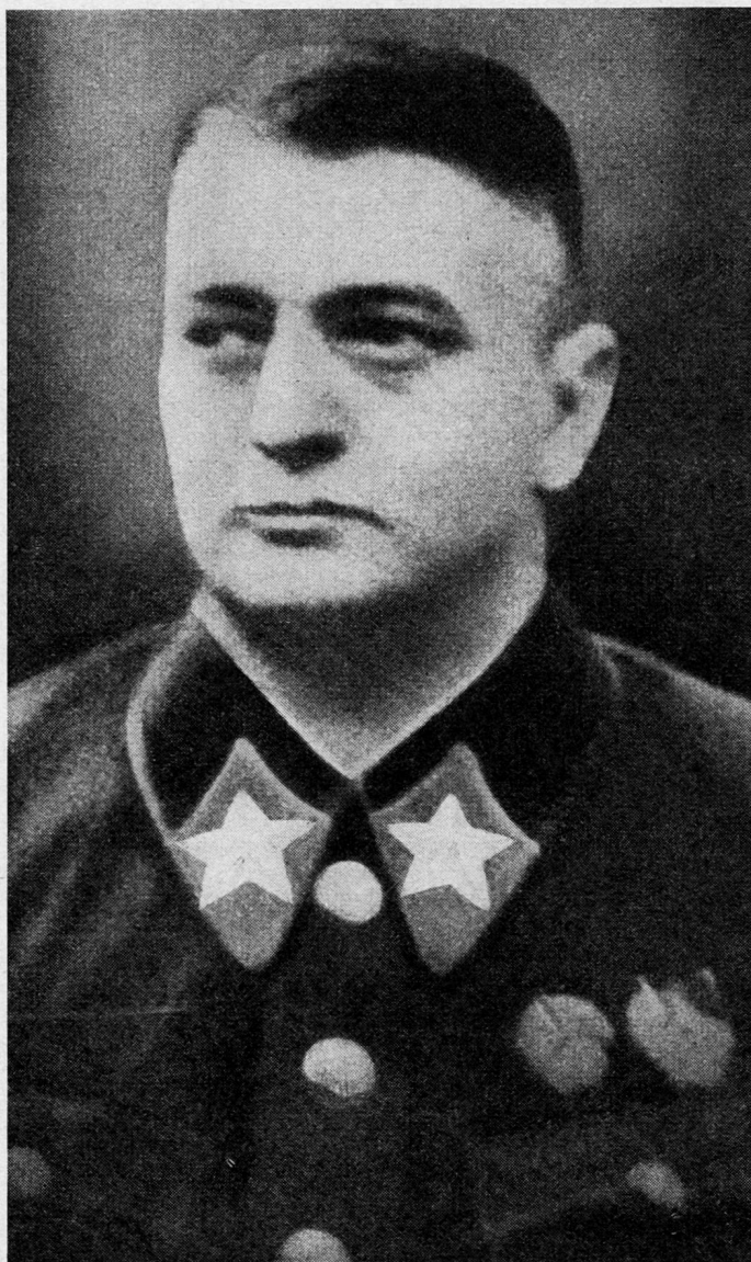
Bild 1. Michail Nikolajewitsch Tuchatschewskij, Marschall der Sowjetunion, Oberkommandierender der Roten Armee, Volkskommissar (beziehungsweise Minister) für Landesverteidigung (1893–1937). Samt Familie hingerichtet.