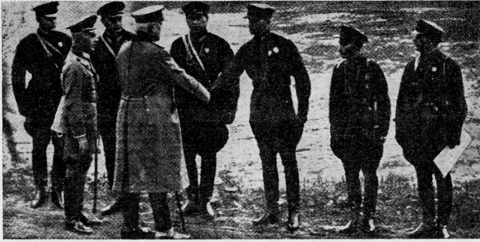
Bild 3. 1932: Reichspräsident Hindenburg begrüßt sowjetische Manövergäste. Tuchatschewskij (dritter von links), «Agent des deutschen Generalstabs».

gefährlichkeit vermindern, denn diese können auch disziplinarisch oder gesellschaftlich verfolgt werden, und zugleich verschärfen sie die strafrechtliche Verantwortlichkeit für schwere und gefährliche Verbrechen, die die Grundlagen der militärischen Organisation untergraben und die Einsatzfähigkeit der Streitkräfte gefährden. [18]