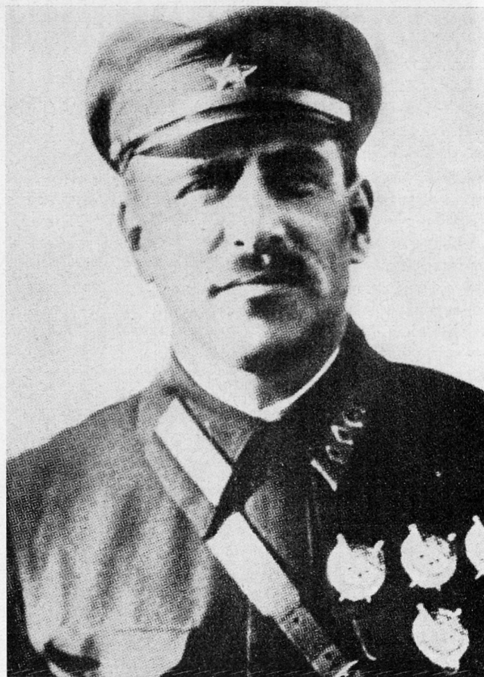
Bild 2. Marschall Wassilij Konstantinowitsch Blücher (Kriegsname), Kommandant der sowjetischen Fernostarmee. (1889–1938.) Erst Richter, nachher Opfer der Jeschowschtschina.

Es waren insgesamt 35 000 Opfer aller Art oder ungefähr die Hälfte des insgesamt 70 000 zählenden Offizierskorps, 3 von 5 Marschällen, 13 von 15 Armeebefehlshabern, 57 von 85 Korpskommandanten, 110 von 195 Divisionskommandanten, 220 von 406 Brigadekommandanten, alle 11 Kriegsvizekommissare, 75 von 80 Angehörigen des obersten Militärrats einschließlich aller militärischen Bezirkskommandanten, die im Mai 1937 im Dienst