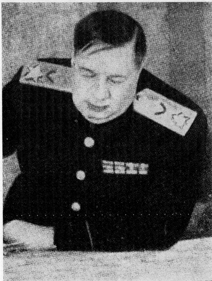
Bild 5. Marschall Fjodor Iwanowitsch Tolbuchin, Kommandant der 3. ukrainischen Front. (1894–1949.) Nach Haftentlassung an die Front.

Einsatzfähigkeit der Streitkräfte Schaden zufügen, werden im Sinne des Gesetzes streng bestraft. Namentlich im Falle von Verstößen gegen die Wach- und Innendienstvorschriften durch die zu diesem Dienst für 24 Stunden abkommandierten Angehörigen der Einheit sieht das Gesetz strafrechtliche Verfolgung, bei mildernden Umständen Disziplinarstrafen vor.