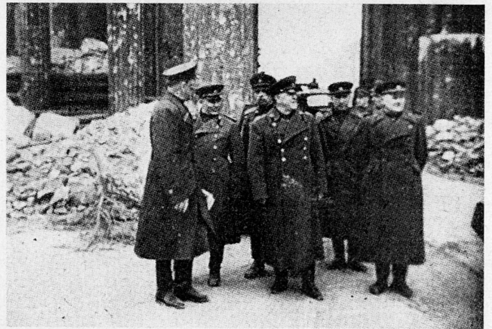
Bild 23. Marschall Schukow am Brandenburger Tor.

lation oder Kapitulation von Berlin. Im Falle der Weigerung wird um 10.15 Uhr der Artilleriebeschuß der Stadt einsetzen.» Darauf kehrte General Krebs in den Bunker der Reichskanzlei zurück, und kurz darauf beging Goebbels Selbstmord. Der Sturm auf Berlin wurde den ganzen 1. Mai über fortgesetzt. «In