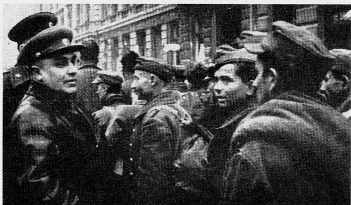
Bild 22. Generaloberst Bersarin, erster sowjetischer Stadtkommandant von Berlin.

lation oder Kapitulation von Berlin. Im Falle der Weigerung wird um 10.15 Uhr der Artilleriebeschuß der Stadt einsetzen.» Darauf kehrte General Krebs in den Bunker der Reichskanzlei zurück, und kurz darauf beging Goebbels Selbstmord. Der Sturm auf Berlin wurde den ganzen 1. Mai über fortgesetzt. «In