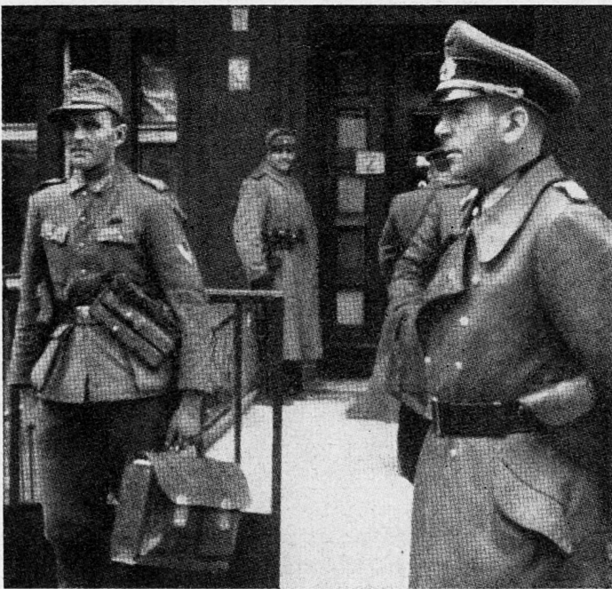
Bild 20. Im Auftrag von Goebbels ersucht am Vormittag des 1. Mai General Krebs um einen bedingten Waffenstillstand. Er wird zurückgewiesen.