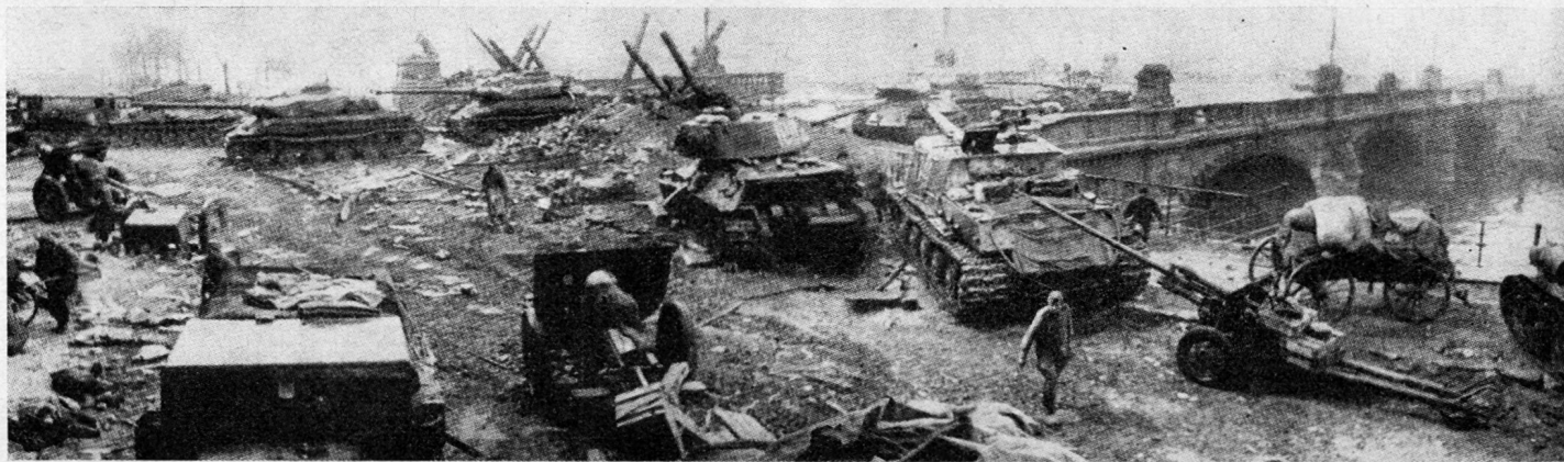
Bild 15. Die Russen setzen zahlreiche Panzer in der 10 Tage lang tobenden Schlacht in den Straßen Berlins ein.

ersten weißrussischen Front nicht schnell genug erschien. Ständige Anrufe bei Marschall Schukow und ständige Einmischungen in die Operationen seitens des Kremls erschwerten nur die Arbeit des ohnehin überanstrengten Stabes des Marschalls 17 . Sollte letztlich Hitler doch noch recht haben? Mußte die Rote Armee bis zu einem gewissen und sehr naheliegenden Zeitpunkt Berlin in ihrer Macht haben, da sonst die Amerikaner vorrückten und die Allianz des Ostens mit dem Westen zerbrechen würde 18 ? Allerdings gab Marschall Schukow den Druck und das Drängen Stalins seinen Armeeführern im gleichen Ton unverzüglich weiter. Kein Erfolg genügte. Immer neue Ziele mußten die Anstürmenden in kürzester Frist erreichen.