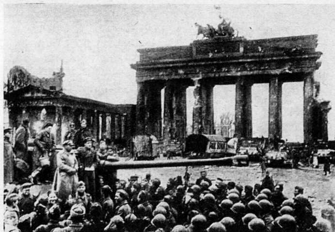
Bild 19. Berlin, 2. Mai 1945. An den Fronten wird noch geschossen. Doch die Sowjets feiern schon den Sieg vor dem Brandenburger Tor.

Verteidigung Berlins folgendermaßen: «Durch irgendwelche Führungsmaßnahmen konnte der Truppe schon nicht mehr geholfen werden. Reserven gab es nicht mehr, und von irgendwelchen Umgruppierungen konnte auch nicht mehr die Rede sein. . . . Auch die Versorgung konnte nicht mehr zentral geführt werden. Soweit ich mich erinnern kann, wurden in der Nacht vom 28. zum 29. April durch Flugzeuge etwa 6 t Versorgungsgüter abgeworfen, das heißt fast nichts! An Munition wurde die Panzerfaust, die die Truppe vor allem benötigte, in ganz geringfügiger Menge abgeworfen; etwa 15 bis 20 Stück. Zu all diesem kam noch eine Schwierigkeit hinzu. Allmählich hörte die Reparatur der im Kampf beschädigten Panzer auf, weil wir keine Möglichkeit besaßen, sie weiter auszuführen. . . . Die Katastrophe war unabwendbar, wenn der Führer seinen Entschluß nicht umstieß, Berlin bis zum letzten Mann zu verteidigen 43 ». Doch General Weidling hatte nicht gewagt, an der vorangegangenen täglichen Lagebesprechung, an der Hitler noch teilnahm, das Wort «Kapitulation» auszusprechen. Nur in der allerletzten Stunde, am 30. April um 13.45 Uhr, wurde den Verteidigern «angesichts der Verknappung der Munition» gestattet, aus Berlin auszubrechen. Sich zu ergeben wurde ihnen strengstens untersagt. Das war alles, was General Weidling bei dem lebenden Hitler noch erreichen konnte.