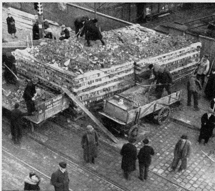
Bild 12. Zwischen Oder und Reichskanzlei werden vom Februar 1945 an zahlreiche Schützengräben, Panzersperren und Bunker errichtet.

Zahl und Stärke der Verteidigung der Reichshauptstadt waren in jenen Apriltagen, als sich die motorisierten Verbände der