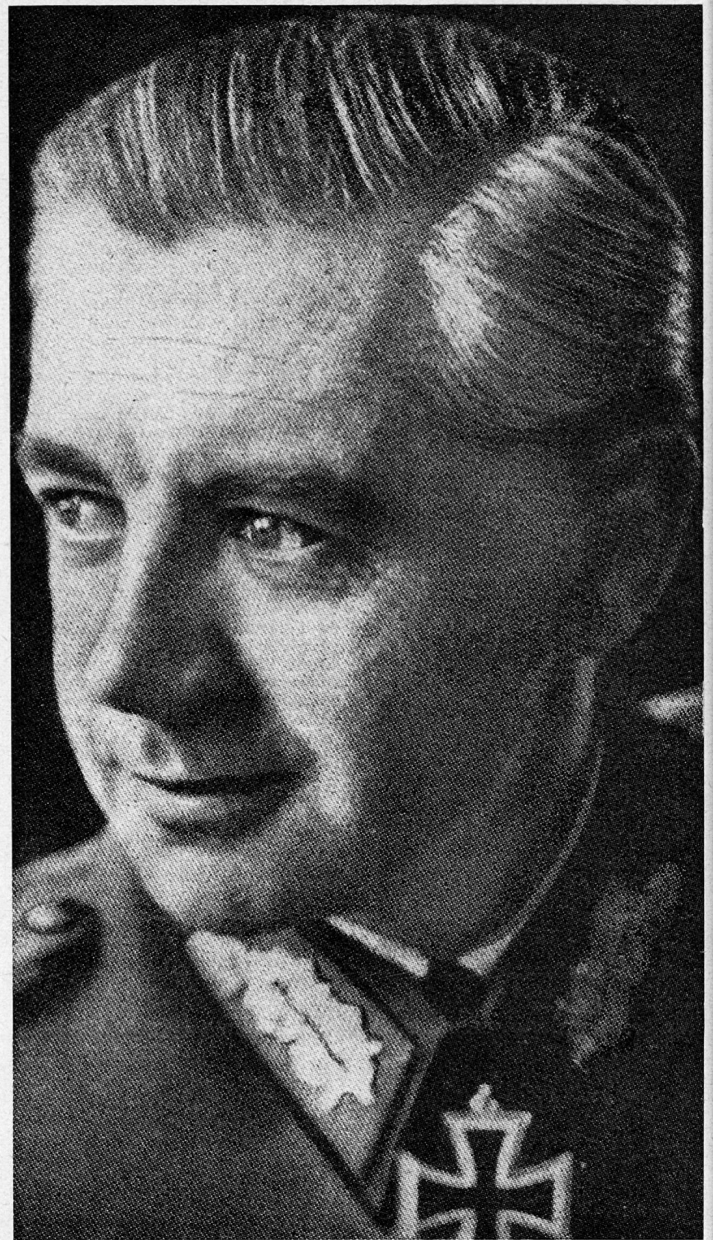
Bild 16. General der Panzertruppen W. Wenck, Oberbefehlshaber der 12. Armee.

«Die nordwestlich von Oranienburg vorgehende ‚Armeegruppe Steiner‘ muß im ersten Durchstoß die Gegend von Bötzw (etwa 10 km nordwestlich von Spandau) erreichen 28 .» Darauf erwiderte General Steiner – nach seinen eigenen Erinnerungen – gegenüber General der Infanterie Krebs,