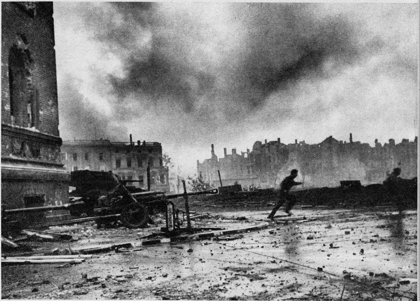
Bild 18. Vom Tiergarten aus kämpft sich sowjetische Infanterie an die Ruine des Reichstagsgebäudes heran, das letzte größere Hindernis vor der dicht verbarrikadierten Reichskanzlei.

die Gefahr eines plötzlichen Durchstoßes in das Zentrum, wo der Wilhelmplatz genau die Mitte bildete. «Neben den regulären Kontingenten stand alles im Kampf, was eine Waffe tragen konnte. Infanterie kämpfte neben Marineeinheiten, Panzerbesatzung zu Fuß neben Piloten zu Fuß, Volkssturm neben Hitlerjugend und Polizei, Freikorps der politischen Kader neben SS. . . . Und Nacht für Nacht brausten die schweren Junkers-Transporter wie schwarze Riesenvögel heran, unentwegt, unbeirrt, kreisten suchend, schwerfällig, in Feuer und Qualm, und landeten mitten im Einschlag von Artillerie, Granatwerfern, Pak und was sonst noch auf der Ost-West-Achse 35 . Und dann sprangen die Marinesoldaten, Kreuzerbesatzungen, U-Boot-Männer, Sturmwikinger heraus – wenn sie es lebend geschafft hatten – und griffen irgendwo neben uns ein, wo nichts mehr neben uns stand, und griffen ein und waren ein Teil dieses Schicksals in Feuer und Zorn 36 .»