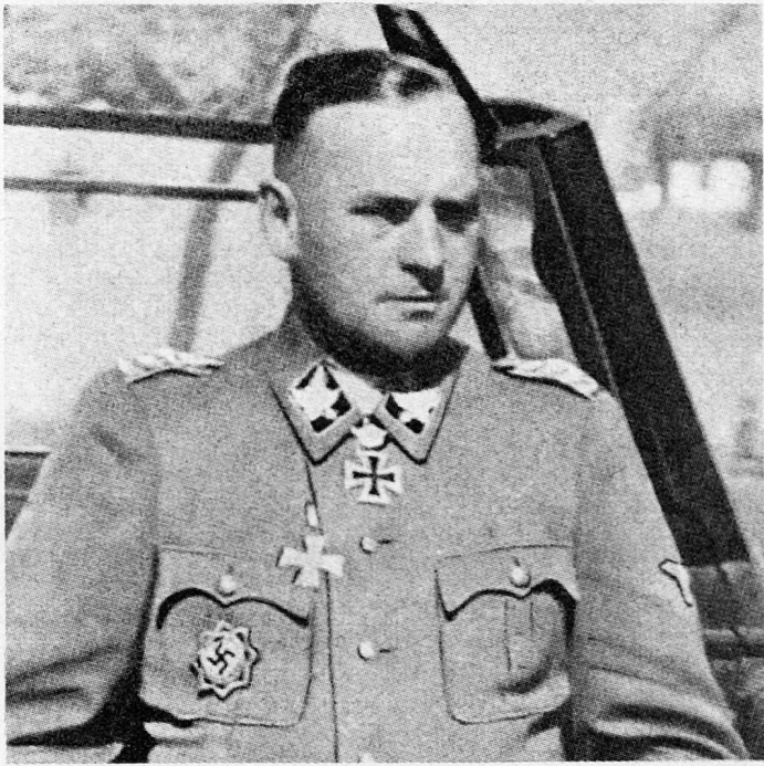
Bild 17. General der Waffen-SS F. Steiner, Oberbefehlshaber der «Armee- gruppe Steiner».

der ihm diesen Befehl aus Berlin telephonisch durchgab und unter anderem den Entsatzversuch der anderen Armeen darlegte, daß er kein Vertrauen in dieses Vorgehen habe: «Ich selbst verfüge nur über 3 Divisionen. Der Angriff ist undurchführbar und sinnlos! In diesem Augenblick brach das Gespräch ab 29 .» Trotz mehrfachen Bemühungen, insbesondere des Oberkommandos der Wehrmacht und des Feldmarschalls Keitel, die Armeegruppe zum Angriff auf Berlin anzutreiben, blieb Steiner bei seiner Weigerung 30 . Auch General Holste, der mit Generaloberst Jodl verhandelte, wies darauf hin, daß seine improvisiert aufgestellten und zusammengewürfelten Verbände ohne erhebliche Verstärkungen nicht zu einem Angriff antreten könnten. Und Generaloberst Heinrici, Oberbefehlshaber der Heeresgruppe Weichsel, mußte sich darauf konzentrieren, die eigene Front mit der ihm allein verbliebenen 3. Panzerarmee gegen das intensive Vorgehen der zweiten weißrussischen Front Rokossowskij zu behaupten. So blieb, trotz allen Bemühungen Hitlers, der deutsche Entsatzversuch auf Berlin von Norden her aus 31 .