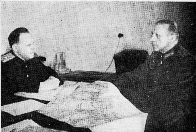
Bild 21. General der Artillerie Weidling übergibt die Stadt Berlin den Russen.