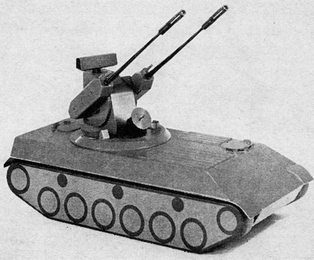
Bild 2. Modell eines Flabpanzers mit Such- und Vermessungsradar und 35-mm-Flabzwilling.

Bild 2 zeigt als Beispiel für eine moderne Lösung das Modell eines Flabpanzers, an dem zur Zeit durch eine schweizerische Firmengemeinschaft entwickelt wird. Der Panzer ist mit leistungsfähigem Radarsystem und 35-mm-Zwillingsgeschütz ausgerüstet.