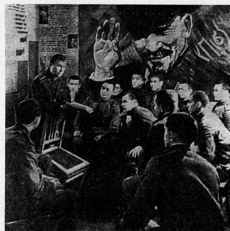
Bild 1. Lenins Partei ist die Leiterin der sowjetischen Streitkräfte. Die gesamte Heeresorganisation ist entsprechend dem Aufbau durch ein festes System von Organisationen der KPdSU und des Komsomol durchzogen. Der Eintritt in die Partei und den Komsomol wird innerhalb der Armee besonders gefördert.

«Die Bolschewiki müssen das Militärwesen kennen», sagte später Lenin zu Frunse, «sie müssen ihre eigenen Offiziere haben, die den Lakaiken des Zarismus an militärischen Kenntnissen überlegen sind 3 .»