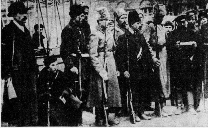
Bild 2. Die Rote Garde – Stoßtrupp der Oktoberrevolution. Den Kern der Roten Garde stellten die Matrosen der baltischen Flotte, Arbeiter der Petrograder Putilow-Werke und Soldaten vor allem einer lettischen Division aus der Petrograder Garnison.

kehrten der Front den Rücken, um zu Hause nicht die Gelegenheit zu verlieren, Land an sich zu bringen.