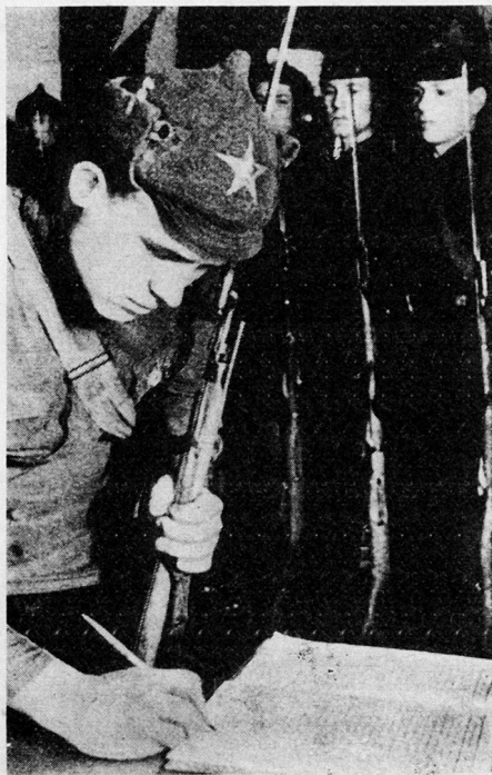
Bild 5. Der 23. Februar 1918 gilt als Gründungstag der Roten Armee. Zuerst gab es keinen Fahneneid. Der Einberufene verpflichtete sich durch seine Unterschrift zur ordnungsgemäßen Dienstleistung als Kämpfer für seine Klasse.

Die Matrosenabteilungen der baltischen Flotte und Einheiten revolutionärer Soldaten aus den Resten der zaristischen Armee haben die deutschen Truppen bei Pskow und Narwa im Februar 1918 geschlagen. Dieser Tag der ersten erfolgreichen Kämpfe gegen die Intervenienten und der Aufstellung der ersten Regimenter der Roten Armee – der 23. Februar – wird seither jährlich als Tag der Sowjetarmee und der Seestreitkräfte feierlich begangen 10 .