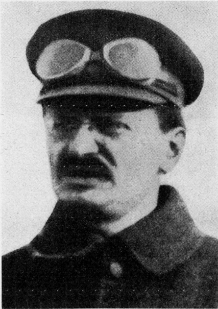
Bild 3. Trotzki, eigentlich Leo Davidowitsch Bronstein, faktischer Begründer, Organisator und erster Oberkommandierender der Roten Armee. Er plante und leitete praktisch allein den bewaffneten Kampf für die Revolution und besiegte mit Hilfe von 40000 «Militärexperten», ehemaligen zaristischen Offizieren, die vielfache Übermacht der Feinde des Sowjetstaates. Stalin verbannte ihn 1929 aus Rußland und ließ ihn am 20. August 1940 in Mexiko durch einen Agenten ermorden.

dreier Kommissare: Podwojski, Antonow-Owssejenko und Dybenko. Dieses Kollegium bereitete das Dekret vom 15. Januar 1918 über die Schaffung einer Freiwilligenarmee vor. Dies war unter den damaligen Bedingungen das einzig mögliche Mittel zur Schaffung kampffähiger Verbände. Aber bereits im Frühjahr 1918 wurde es in Verbindung mit der Intervention der Entente gegen Sowjetrußland klar, daß die Rote Armee, die sich nach dem Prinzip der Freiwilligkeit formiert und im April 1918 eine Gesamtstärke von 300000 Mann erreicht hatte, die massierten Kräfte der Feinde nicht werde zerschlagen können.