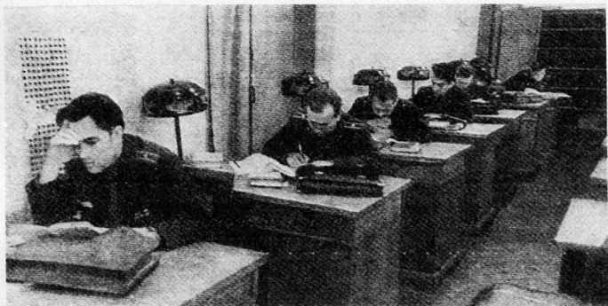
Bild 5. Zukünftige Politoffiziere studieren an der Lenin-Militärakademie für Politik. Das Verhältnis zwischen dem militärischen Kommandanten und dem ihm zugeordneten politischen Vertreter Kommissar, Politruk, Sampolit gehörte und gehört auch noch heute zu den schwierigsten und umstrittensten Fragen bei der Verteilung von Kommandogewalt und Verantwortung in der Sowjetarmee.

schon im Juni 1917 spannte sich ein weites Netz von Parteizellen über vorgeschobene und rückwärtige Einheiten. Die Bildung von Soldatenräten und Parteizellen sorgte dafür, daß der revolutionäre Geist der Truppe aufrechterhalten werden konnte. Die Pflicht eines Kommunisten, schrieb Trotzki, sei es, «über die Moral der anderen Soldaten zu wachen», sie von Stunde zu Stunde zu ermuntern, «ihre Arbeit genau im Auge zu behalten», und sie durch das eigene Beispiel anzufeuern.