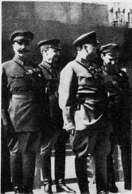
Bild 8. Führer der Roten Armee nehmen eine Parade ab; Budjonni, Woroschilow, Gamarnik. Gamarnik wurde während der großen Säuberung hingerichtet.

Frunse konnte seine großangelegte Arbeit nicht mehr beenden. Er verstarb im Jahre 1925 im Verlauf einer Operation. Die großen Veränderungen, die sich innerhalb der Streitkräfte in den zwanziger Jahren vollzogen hatten, verlangten eine Reihe organisatorischer Maßnahmen auf dem Gebiet der oberen Führung der Streitkräfte. Am 20. Juni 1934 löste das WZIK den Revolutionären Kriegsrat auf und bildete das Volkskommissariat für Verteidigung der UdSSR, das den militärischen Aufbau zu leiten hatte. Zum Volkskommissar für Verteidigung wurde K. J. Woroschilow ernannt, der seit dem 6. November 1925 Vorsitzender des Revolutionären Kriegsrates war 20 . Stellvertreter des Volkskommissars für Verteidigung wurde M. N. Tuschatschewski.