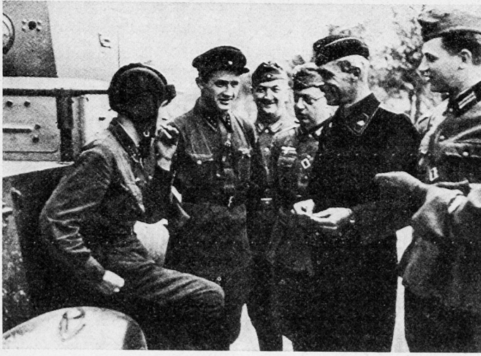
Bild 7. Im Hitler-Stalin-Pakt vom 23. August 1939 wurden Ostpolen und die baltischen Staaten den Sowjets zugesprochen. Die deutsche Wehrmacht und die Rote Armee eroberten gemeinsam Polen. Hier deutsche Soldaten im freundlichen Gespräch mit ihren sowjetischen Waffenbrüdern in Polen.

widersetzen, und kurze Zeit darauf wurden auch Bessarabien und die nördliche Bukowina der UdSSR einverleibt.