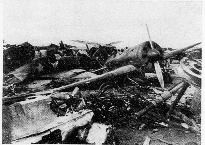
Bild 8. Am 22. Juni 1941 ließ Hitler die deutsche Wehrmacht mit 17 motorisierten und 19 Panzerdivisionen den Angriff auf die Sowjetunion beginnen. Nur wenige sowjetische Jäger kamen noch zum Start; die meisten wurden vorher auf ihren schlecht geschützten Plätzen aus der Luft zerstört. Der Rest der Maschinen ging im Kampf unter.

Streitkräfte, die eine rigorose Untersuchung des Zentralkomitees der KPdSU (B) nach dem Finnlandkrieg aufdeckte, wurden eine neue Felddienstvorschrift und neue Kampfvorschriften für alle Waffengattungen herausgegeben. Es begann eine breit angelegte Reorganisation und Umrüstung der Roten Armee auf neuer technischer Grundlage. Dabei sollten die Verbände mechanisiert und motorisiert werden. Dieses Vorhaben war großzügig geplant und sollte nach seinem Abschluß das Antlitz der Sowjetstreitkräfte grundlegend ändern. Bis zum Beginn des deutsch-russischen Krieges konnte die notwendige Anzahl mechanisierter Verbände jedoch nicht mehr aufgestellt werden. Die strukturell umgebildeten Schützendivisionen sowie die Einheiten der speziellen Waffengattungen und der Luftstreitkräfte waren waffenmäßig und technisch ebenfalls ungenügend ausgerüstet. In der gesamten Armee fehlten Transportmittel, besonders Artilleriezugmittel. Ein beträchtlicher Teil der sowjetischen Truppen in den grenznahen Militärbezirken besaß nicht die notwendigen Kenntnisse in der Anwendung der modernen Kampftechnik und der technisch hochwertigen Waffen, weil die Feldarmeen aus Kontingenten gebildet worden waren, die erst kurz vor Kriegsausbruch den Dienst angetreten hatten 24 . Auf Grund all dieser Faktoren befand sich die deutsche Wehrmacht kampfmäßig in einer günstigeren Lage, als sie am 22. Juni 1941 morgens um 4 Uhr überraschend Rußland angegriffen hatte.