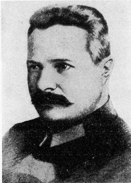
Bild 7. M. W. Frunse, Kriegskommissar und Reformator der Roten Armee. Er entwarf die Grundlagen der sowjetischen Militärdoktrin, die bis heute ihre Gültigkeit hat. Frunse betrachtete ebenso wie Trotzki die Rote Armee als «Armee der Weltrevolution».

Vorsitzenden des Revolutionären Kriegsrates und zum Chef des Stabes ernannt. Das Aprilplenium der ZK der Partei nahm am 1. April 1924 den Bericht Frunses über das Militärische Amt entgegen, und es stellte die Forderung, die verantwortlichen Posten in der Armee mit Kommandanten und Verwaltungsleitern zu besetzen, die Mitglieder der Partei sind. Am 17. Januar 1925 beschloß das Plenum des ZK, Trotzki von der Funktion des Vorsitzenden des Revolutionären Kriegsrates der UdSSR zu entbinden und aus der militärischen Arbeit zu entfernen. Trotzki nahm diese Degradierung willig hin, ja er scheint sie selbst vorgeschlagen zu haben, denn, wie er später schrieb, war er darum besorgt, jeden Verdacht zu zerstreuen, daß er auf eine «bonapartistische» Restauration hinarbeitete. Schließlich ließ ihn Stalin am 14. November 1927 kurz nach dem zehnten Jahrestag der Machtergreifung der Bolschewiki auch aus der Partei entfernen 16 .