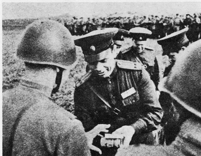
Bild 3. Abendappell bei den sowjetischen Interventionstruppen bei Prag. Die besten Soldaten erhalten Schokolade und Zigaretten.