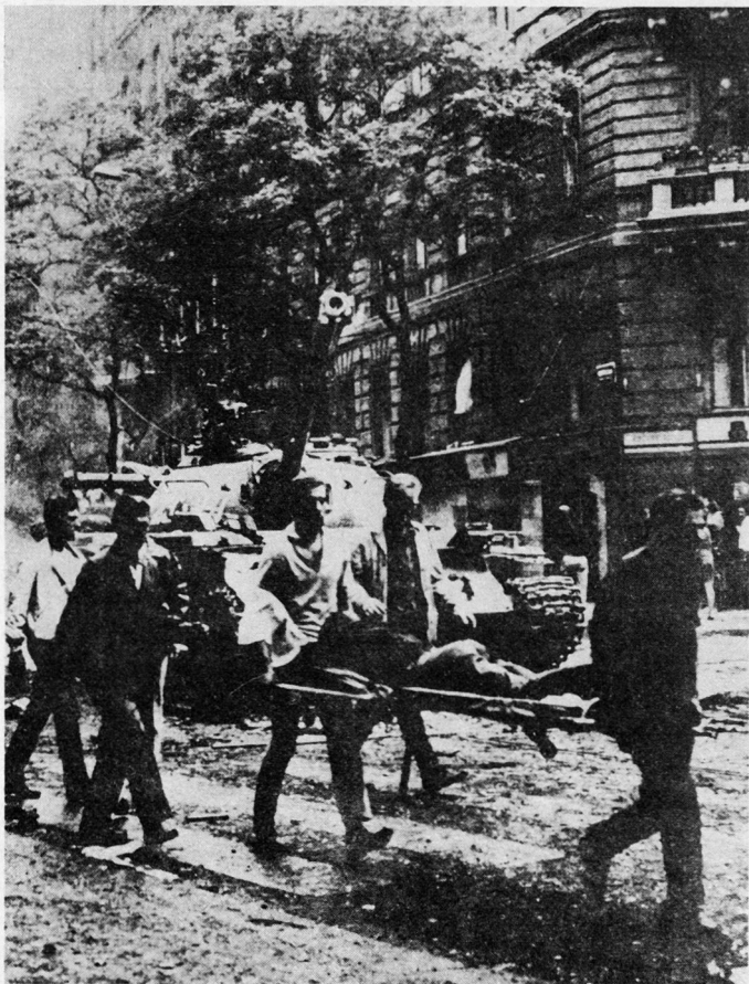
Bild 2. Die Okkupanten töteten fast hundert unbewaffnete Personen und verletzten siebenhundertzwei Bürger der CSSR.

«In der CSSR gewinnt die Konterrevolution die Oberhand. Die Rückkehr zur Vorkriegsbourgeoisie wird sogar im Aktionsprogramm der KPTsch gefordert, dessen Implikationen sich gegen die Grundlagen des Sozialismus richten ... Die konterrevolutionäre Politik trieb bereits unzählige aufrechte Kommunisten und loyale Söhne der Arbeiterklasse in den Selbstmord. Die von den tschechoslowakischen Vertretern gegebene Versicherung der Freundschaft zur Sowjetunion und den übrigen sozialistischen Verbündeten ist wertlos, denn diese Leute kontrollieren die Entwicklung nicht mehr. Die Kontrolle ist den Behörden in einem Maße aus der Hand gegelitten, das sogar die Situation an der tschechoslowakischen Grenze unklar macht ... Die Dinge gehen so weit, daß nicht mehr von einer internen Angelegenheit der CSSR gesprochen werden kann. Das jetzige tschechoslowakische Regime läßt Feinde in das Territorium des Warschauer Paktes eindringen ... Im Falle der Intervention [durch die sozialistischen Länder], die auch ein militärisches Eingreifen beinhalten kann, würden kollektive Maßnahmen ergriffen.»