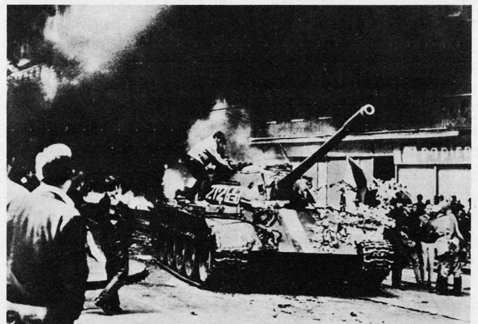
Bild 1. Dialog unter lebensgefährlichen Umständen mit Besetzungstruppen.