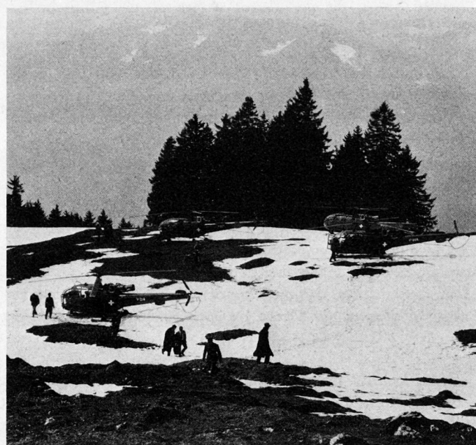
Bild 2. Landung einer Helikopterstaffel auf Ächerlialp.