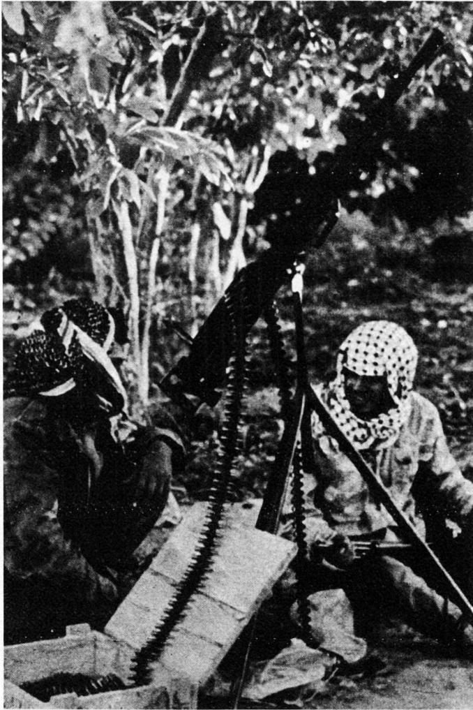
Bild 3. Flabmaschinengewehr.

sche Waffen chinesischer Lizenz, wie Maschinengewehre und Minenwerfer. Sehr beliebt bei den Guerillas ist das russische Sturmgewehr «Kalaschnikow», da es leicht, robust, handlich und für Feuerüberfälle gut geeignet ist. Aber auch «Katjuscha»-Raketen, Bazookas, Handgranaten, erbeutete israelische Waffen, englische und französische Maschinenpistolen aus dem zweiten Weltkrieg und russisch-chinesische Minen fehlen nicht in dem uneinheitlichen Waffensammelsurium, das besondere Probleme für Munitions- und Ersatzteilmachschub stellt. Schwere Waffen, wie Artillerie und Panzer, fehlen vollständig, Fliegerabwehrgeschütze sind nur wenige vorhanden, meistens werden Maschinengewehre auf behelfsmäßigen Flablafetten montiert. Der Mangel an genügenden Fliegerabwehrmitteln wird von den Guerillas bei der israelischen Luftüberlegenheit als besonders schmerzlich empfunden.