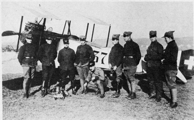
Oskar Bider (kniend) im Kreise seiner Fliegerkameraden, vor dem zweiseitigen Aufklärungsflugzeug Wild.

Arbeiten fand, brachten mir nur arge Enttäuschungen und schwere Sorgen. In diesen zwei Kriegsjahren ist es nicht möglich geworden, eine Fliegertruppe aufzustellen, die nur annähernd unsern Verhältnissen entsprechen könnte.»