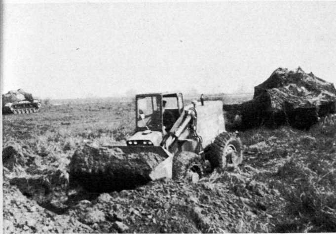
Bild 1. Ein Panzer M 60 A 1 wartet getarnt, bis seine Deckung fertig ist.