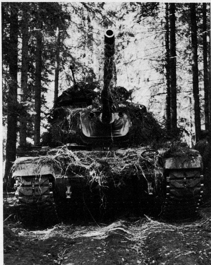
Bild 4. In Bereitstellung zum Angriff.