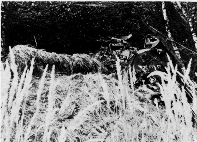
Bild 3. Ein derart eingegrabener und voll getarnter Panzer bietet ein sehr kleines Ziel.