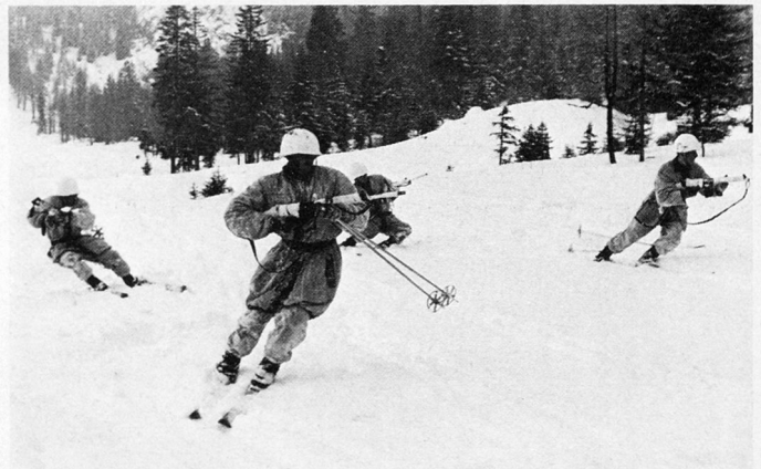
Bild 22. Der Einsatz in der Waldregion erfordert rasche Reaktionsfähigkeit von den Soldaten.