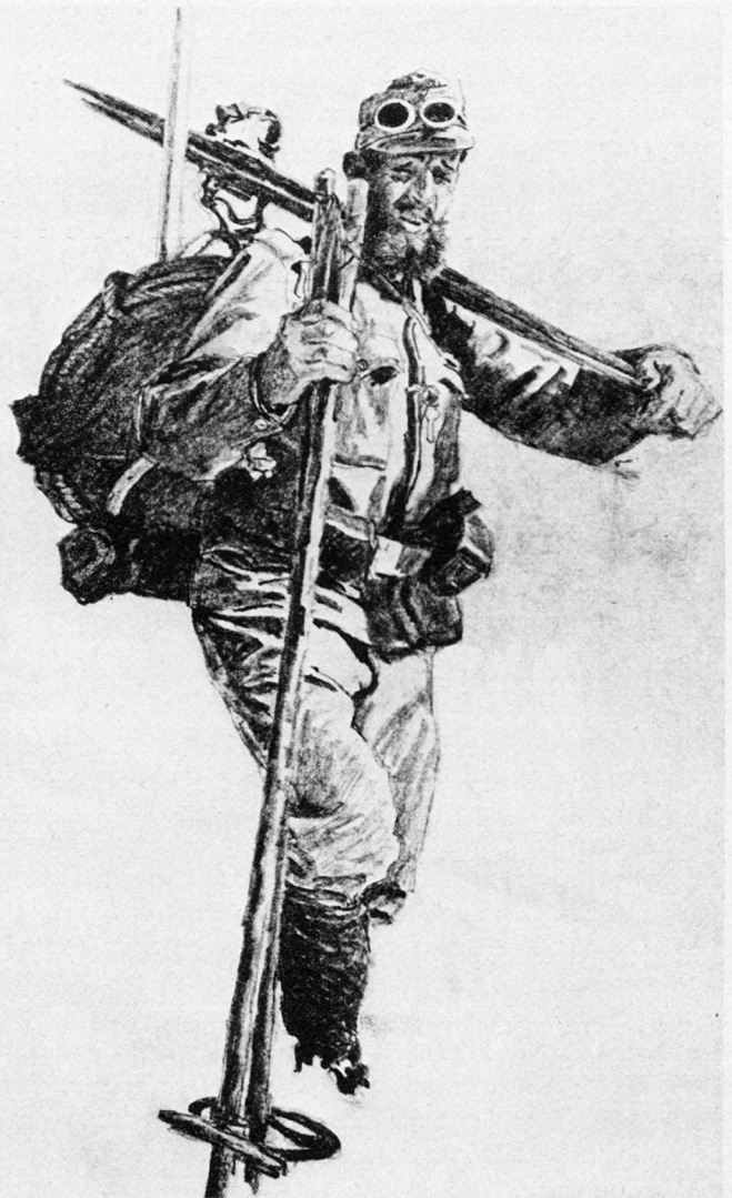
Bild 19. Bergführerkompagnie, Heeresbergführer aus Sulden im Einsatz am Ortler.

Um eine zweckentsprechende rasche Lösung alpiner Bauaufgaben zu ermöglichen, wurde im Rahmen der Bergführerkompagnien je ein Bauzug aufgestellt. Die erforderlichen bergerfahrenen Schreiner, Zimmerleute und Schlosser wurden diesen Zügen zugeteilt. Die Organisation der Bauzüge bewährte sich