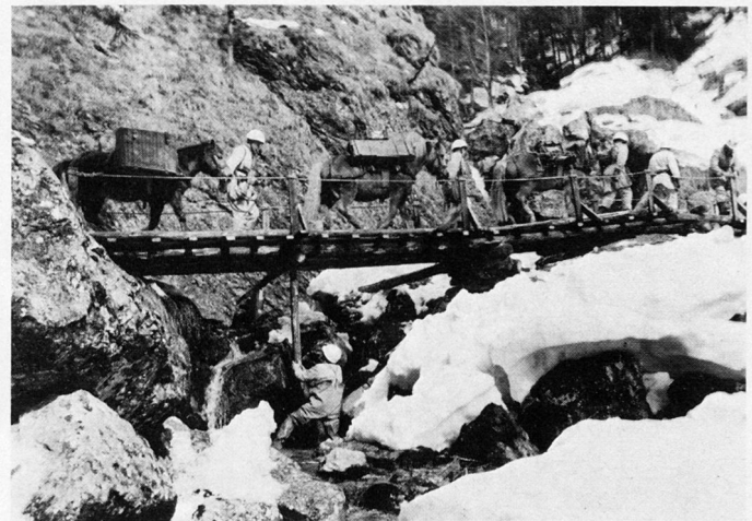
Bild 23. Gebirgspioniere und Tragtierstaffeln sind nach wie vor die unentbehrlichen Helfer der Gebirgstruppe.