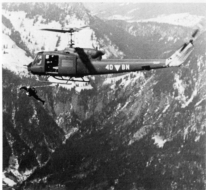
Bild 25. Freiwillige des qualifizierten Alpinpersonals stehen nach ihrer Fallschirmausbildung für Sondereinsätze im Hochgebirge zur Verfügung.