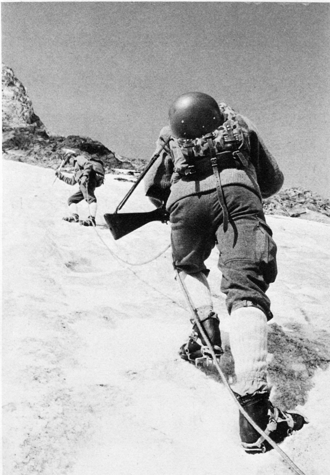
Bild 21. Erfahrung und Leistungsfähigkeit entscheiden über den Erfolg des Alpinisten und Soldaten.

Kommissionelle Prüfungen in Praxis und Theorie beenden alle Kurse. Eignet sich der Kursteilnehmer zur weiteren Ausbil-