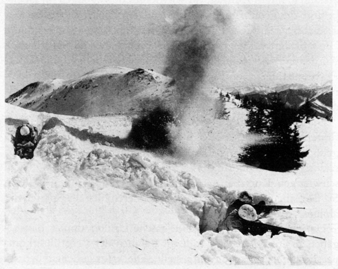
Bild 20. Eine wirklichkeitsnahe, harte, aber sinnvolle Ausbildung bestimmt weitgehend den Einsatzwert einer Truppe.

Je größer der Anteil eines Landes an Gebirgen im Verhältnis zur Gesamtfläche ist, um so mehr wird sich bereits die friedensmäßige Vorsorge, die der Truppe alle Möglichkeiten auch einer gezielten alpinen Ausbildung bietet, auf ihre Einsatzbereitschaft auswirken. Ein Blick über die Grenzen zu Staaten, die einen bei weitem nicht so hohen Anteil an Bergland besitzen wie Österreich, zeigt, daß man auch dort auf die Aufstellung spezieller Hochgebirgsformationen nicht verzichtet hat. Die Erfahrung beweist, daß diese bei Kampfhandlungen im schwierigen Gebirgsgelände immer wieder zu Aufklärungszwecken oder als Wegbereiter der Truppe eingesetzt werden mußten. Aus diesen