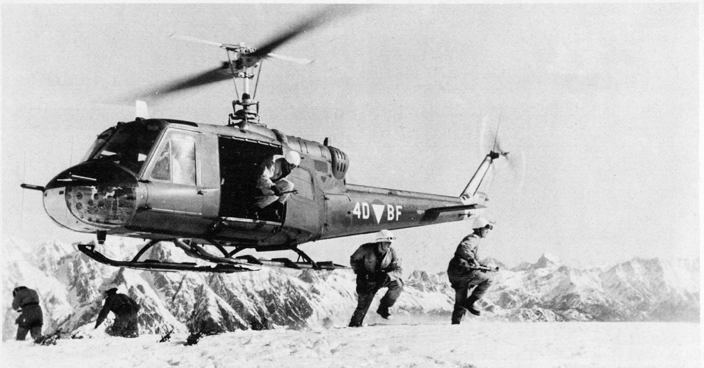
Bild 24. Enge Zusammenarbeit mit den Hubschrauberverbänden bietet der Gebirgstruppe entscheidende Überraschungsmomente in ihrem Handeln.

Schulkommando. Ihm obliegen die taktische und ausbildungsmäßige Führung der Schule sowie die Erledigung der administrativen Aufgaben.