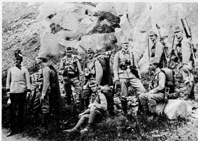
Bild 18. Kaiserschützenuniformen, 1908.