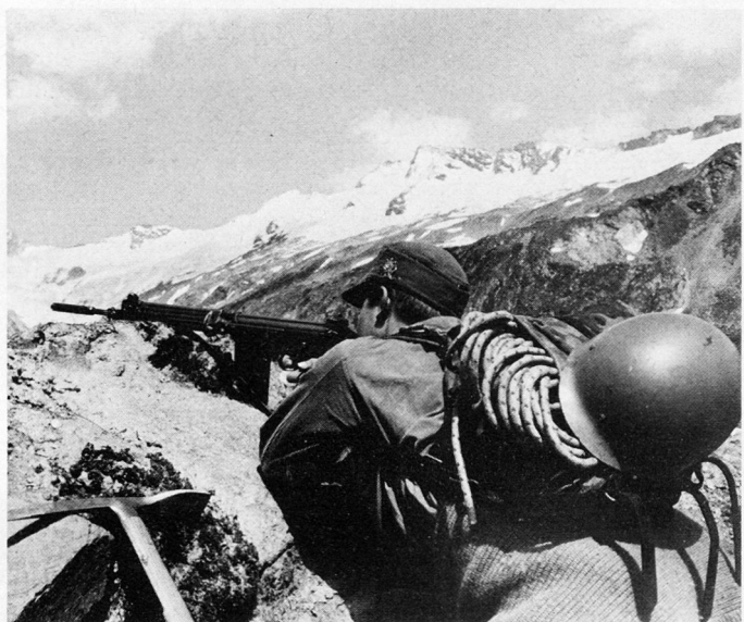
Bild 26. Sommer- und Winterausbildung müssen einander ergänzen.