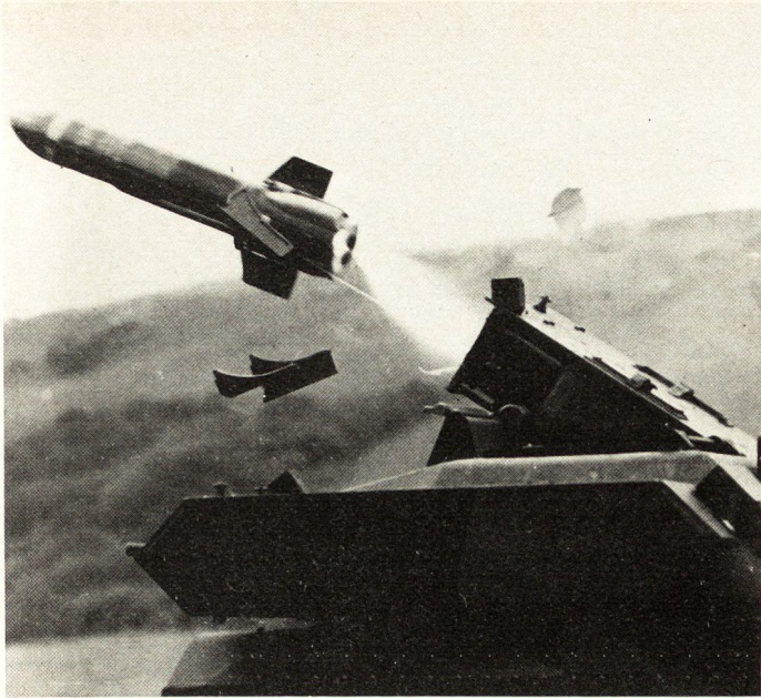
Bild 1. Abschub einer «Swingfire»-Fernlenkwaffe. Links hat sich das Lenkwaffengeschoß unter einem charakteristisch steilen Winkel aus dem Behälter gelöst; Teile der Verschaltung fallen weg.

Jedes Lenkwaffengeschoß wird in der Fabrik in einen hermetisch verschlossenen Abschubbehälter eingeführt. Nachdem dieses Abschubrohr in die gepanzerte Vorrichtung des Fahrzeuges oder des Bodenabschubstandes montiert ist, werden die Schaltverbindungen mittels eines Schiebekontaktes hergestellt. Nach der Zündung des «Boosters» durchbricht die Lenkwaffe eine Metallfolienmembran, wobei der Düsenstrahl durch den Sockel der Abschubvorrichtung entweichen kann. Zwei Führungsschienen stehen im Eingriff mit dem Lenkwaffengeschoß; sie dienen der genauen Führung desselben im Moment des Abschusses.