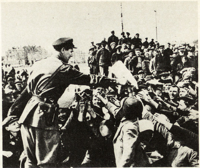
Bild 6. Die befreite Bevölkerung von Odessa wird durch die politische Abteilung einer Armee mit Zeitungen versorgt.

Und weiter: «Im Krieg herrschte dort Ordnung, wo die Truppe vor ihren Kommandanten mehr Angst hatte als vor den Deutschen ... Ein Kommandant, der das mitbekommt, hat Erfolg. Der Auftrag wird erfüllt, und seine Brust ist voller Orden!» «Und die Menschen?» fragte ihn nun sein Gesprächspartner. Der Major a D: «Sie sagen immer, die Menschen, die Menschen ... Ich erinnere mich an so einen Fall. Bei Witebsk haben sie einen verurteilt. Es war ein frischgebackener Leutnant. Er führte eine Batterie. Vor ihnen lag ein kleiner Fluß, und sie suchten eine seichte Stelle. Es fiel ihm schwer, jemanden damit zu beauftragen. Einer war verwundet, ein anderer krank, der dritte war alt, der vierte konnte nicht schwimmen und so weiter. Er ging dann selbst mit einem Melder. Sie fanden eine seichte Stelle und kamen auf die andere Seite. Aber da waren die Deutschen. Und die haben ihn geschnappt. Er hatte auch noch seine Karte mit der Marschroute bei sich. Die führungslose Batterie wurde von den Deutschen vernichtet. Der Leutnant ist allerdings aus der Gefangenschaft entflohen und kam nach einer Woche wieder. Da hat man ihn natürlich vors Peleton gestellt. Was konnte man auch anderes tun? Der hatte Mitleid mit seinen Leuten 43 !»