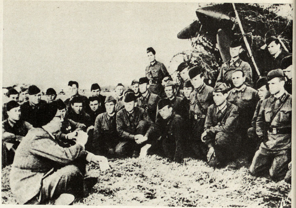
Bild 5. Der sowjetische Schriftsteller Alexej Tolstoi, Nachkomme von Graf Leo Tolstoi, liest aus seinem neuesten Kriegsroman vor einer Luftwaffeneinheit der Roten Armee.

und Suworow, Napoleons große Gegenspieler, vor Augen führte. Die bereits 1936 begonnene Reorganisation, aus einer Roten Armee der Arbeiter und Bauern eine russische nationale Armee zu schaffen, erreichte ihren Höhepunkt im Jahre 1943. Neue Uniformen und Rangabzeichen, die denjenigen der bisher verpönten zaristischen Armee bis auf Kleinigkeiten glichen, wurden damals – parallel zum Sieg bei Stalingrad – eingeführt. Im sowjetischen Hinterland wurde diese Maßnahme nicht gerade begrüßt. Bolschewiken der alten Schule und Bürgerkriegsveteranen fühlten sich betrogen, als sie erstmals Offiziere der Roten Armee «in beinahe zaristischen Uniformen vor sich sahen» 35 . Auch in anderen Bereichen des Armeewesens wurden neue Regelungen eingeführt. Die Kommandanten hießen von Januar 1943 an wieder offiziell «Offiziere», und auch die Kommissare erhielten Offiziersrang und waren nunmehr nicht anderes als Offiziere mit besonderen Aufgaben.