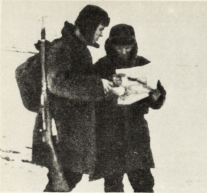
Bild 7. Die sowjetische Presse erreichte die Soldaten sogar während des Marsches. In einer Marschpause lesen Rotarmisten die neuesten Nachrichten.

zu äußern. So erfuhr man gleichzeitig, ob der Rotarmist das Material verstanden und dieses sich zu eigen gemacht hatte. Wo dies nicht der Fall war, kümmerte sich in der Folge der Parteiagitorator um die weitere Erziehung der Soldaten. Man darf daher die Wirkung der Militärpresse in der Roten Armee keineswegs unterschätzen. Sie diente sowohl als Erziehungs- als auch als Kontrollmittel in der Armee.