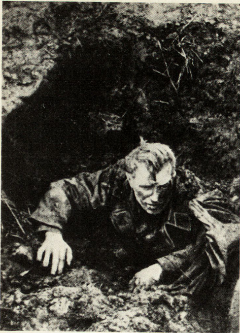
Bild 4. Das Los der Kommissare in deutscher Gefangenschaft. Erbeutete deutsche Photographie, die die «lebendige Begrabung eines sowjetischen Leutnants» zeigt. Der rote Stern am Mantelarm des Offiziers weist ihn jedoch als Kommissar aus.