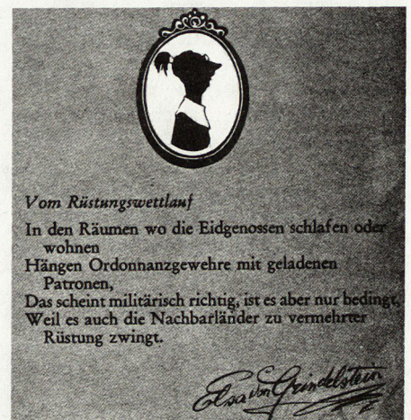
Aus dem Nebelspalter