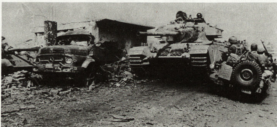
12. Oktober 1973: Israelische Truppen auf dem Weg zum Golan

– Ein Hinweis auf die Richtigkeit unserer Methode, Gegenschläge sorg-