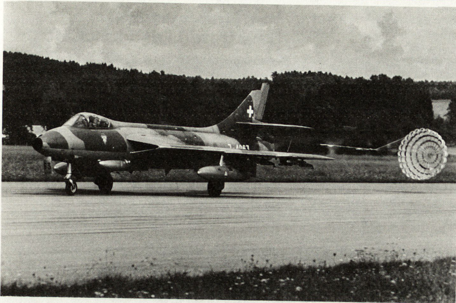
Erdkampfflugzeug Hunter bei Landung.

Mann und Tag, technischer Dienst hat (Priorität) sind alle Elemente beisammen für den Ausbaunetzplan .