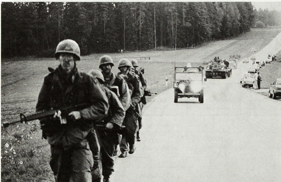
Bild 2. Von Panzerhaubitze und Troß begleitete Gruppe stößt vor. Bild aus dem Manöver 1976, «Lares Team».

Nach mehr als 30 Jahren ist «der Adler der 101. US-Division» 1976 wieder in Europa gelandet! Der 101. Division wurde hier erstmalig die Möglichkeit geboten, Einsatzgrundsätze, Möglichkeiten und Leistungen von Luftangriffseinheiten beim Einsatz unter den spezifischen Verhältnissen Europas