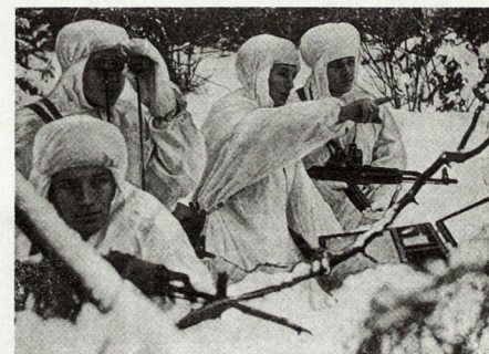
Bild 1. Die Fähigkeit, sich jedem Gelände und jeder Witterung anzupassen, ist eine der herausragenden Eigenschaften der sowjetischen Soldaten.

So hat die sowjetische militärische Führung die Voraussetzungen geschaffen, die es ihr erlauben, ihre hohen Forderungen an die Truppe auch für Winteroperationen und Wintergefechte zu stellen.