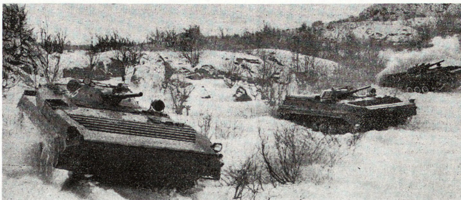
Bild 4. Der gute, geländegängige Schützenpanzer BMP im Winter. Die technischen Probleme scheinen gelöst zu sein, aber die taktischen?

- Die Verteidigung beschränkt sich auf Ortschaften, Straßenkreuzungen und sonstige wichtige Punkte. Sie hat sich an natürliche Hindernisse anzulehnen, die im Winter schwer zu passieren sind. Alle Deckungen vor dem vorderen Rand der Verteidigung, die vom Gegner ausgenützt werden können, sind zu verminen oder müssen im Bereich des schweren Artilleriefuers