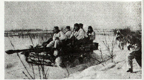
Bild 3. Sowjetische Luftlandetruppen, aufgefressen auf dem ASU 57.

- Die Schneedecke erhöht die Wirkung atomarer Einsatzmittel . Die