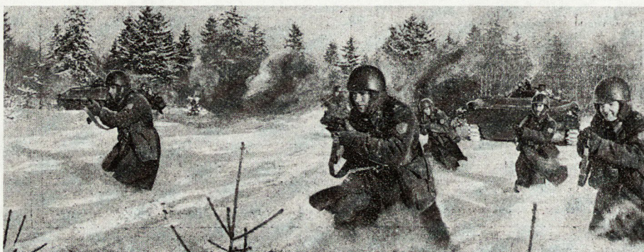
Bild 2. Panzer und Motorschützen im Winterkampf.

Die Berücksichtigung dieser Faktoren eines Gefechts unter winterlichen Bedingungen findet in den sowjetischen Führungsvorschriften ebenso wie in zahlreichen Artikeln der militä-