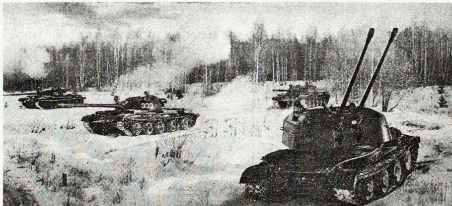
Bild 5. Panzer und Fliegerabwehr bei Ausweitung des Brückenkopfes (T62 und ZSU 57/2).

liegen. Alle Möglichkeiten, die Stellungen durch den Einsatz von Pionieren zu verstärken, müssen ausgenützt werden. Minensperren sind ständig zu überwachen; auf solide Tarnung sei besonders zu achten.