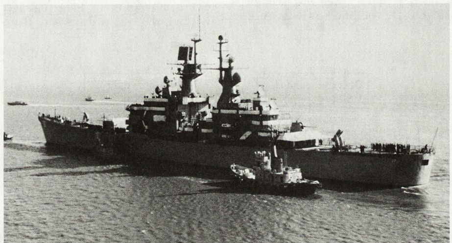
Bild 1: Atomgetriebener Raketenkreuzer «South Carolina» (Quelle: US-Navy).

Neben den rein militärischen Zielsetzungen ergeben sich für die Flotte eine Reihe weiterer Aktivitäten . «Goodwill-Flottenbesuche» (in einigen besuchten Ländern mit Demonstrationen beantwortet), Hilfeleistungen bei Naturkatastrophen oder die Evakuierung von US-Staatsbürgern und weiteren Zivilisten auf Kriegs-