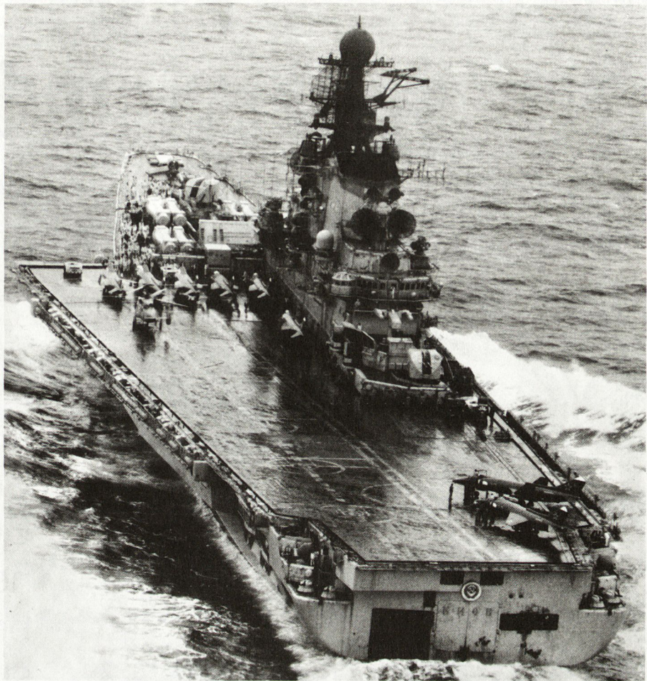
Royal Air Force, No. 42 Squadron, St. Mawgan.

Das Bild zeigt den russischen Flugzeugträger «Kiew» auf Fahrt im Nordatlantik. Gut erkenntlich sind auf dem Flugdeck einige Träger-Kampfflugzeuge vom Typ Yak-36 Forger (Senkrecht/Steil-Start und -Landung) sowie Kamov-Ka-25-Hormone-Helikopter zur U-Boot-Bekämpfung. Am