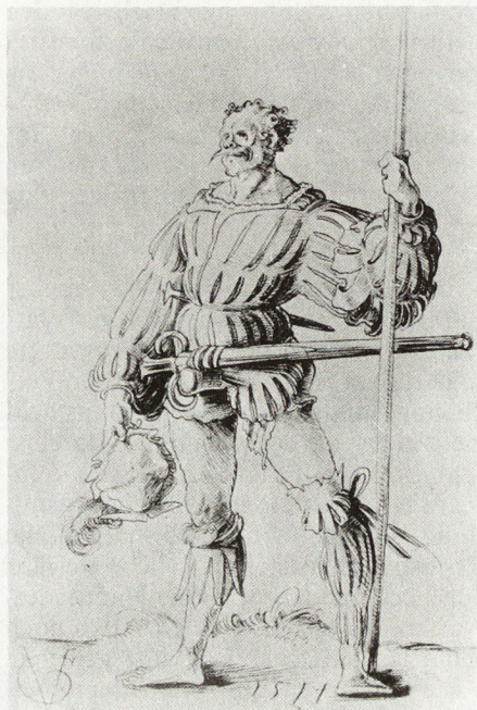
Bild 1. Urs Graf, Schweizer Krieger zur Zeit von Marignano.

die Bewaffnung des Landsturms und der Landwehr mit Morgensternen und Sensen in Vorschlag bringt und aus Ilanz ebenfalls in einer Petition noch der Wunsch nach einem «kriegserfahrenen Führer» beigesteuert wird, der in der Lage wäre, «ein Morgenstern-Reglement zu entwerfen und einzu-