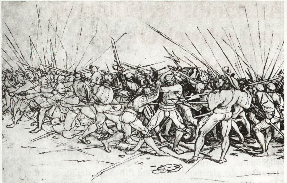
Bild 2. Hans Holbein d. J., Schweizer gegen Landsknechte in Oberitalien.

«Selten ist bei ihnen die Pflege des Geistes, und der hervorragenden Tugend wird keine Ehre gezollt. Dieser unedle Pöbel,