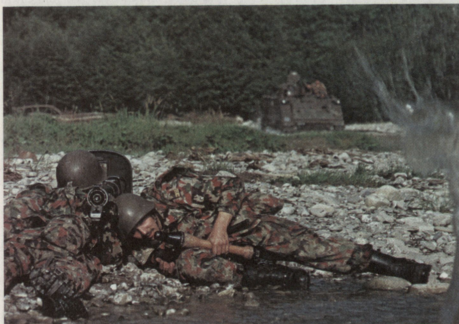
Bild 2: Schützenpanzer 63/73 einer Panzergrenadierkompanie beim Überqueren eines Flusses.

der Lage, diese Gefechtsnachrichten detailliert und umfassend zu übermitteln. Immer wieder muss man jedoch bei Manövern feststellen, dass dem Nachrichtendienst zu wenig Beachtung geschenkt wird und wichtige Meldungen nicht oder ungenau übermittelt werden. Es kann sein, dass die jeweiligen Übungsbestimmungen über Markeure und Feinddarstellungen zu wenig ernst genommen werden oder dass es nur an der Vorstellungskraft der Truppe fehlt. Beachtenswert ist jedoch die Feststellung, dass auch bei Kriegshandlungen im Ausland auf dem Sektor Nachrichtendienst immer wieder unbegreifliche Fehler vorkamen.