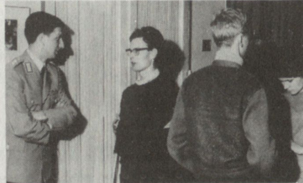
Bild 2. Das persönliche Gespräch und die Diskussion mit den jungen Menschen sind entscheidend.

absolutes Minimum bildet, mehr oder weniger befruchten.