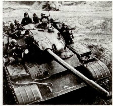
Bild 5. Mot-Schützen haben die Linie des Absetzens erreicht.