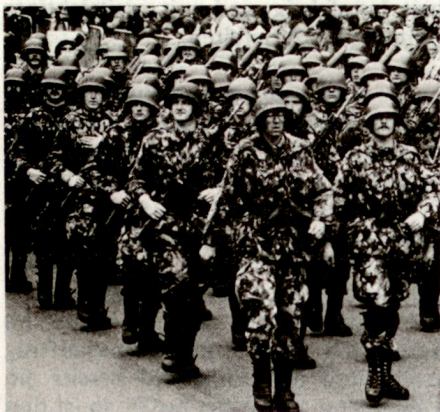
Bild 4. 81% der Schweizer sind der Auffassung, dass sich unser Land im Falle eines militärischen Angriffes mit Waffengewalt wehren müsse.

sind, dass sich unser Land im Falle eines militärischen Angriffes mit Waffengewalt wehren müsse. Selbst bei den Befragten unter 35 Jahren ist eine klare Mehrheit von über 76% vorhan-