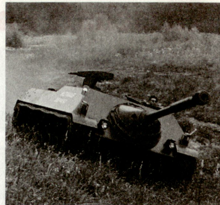
Bild 2. Versorgung der Armee mit möglichst wirksamer und zahlenmässig genügender Ausrüstung bedingt einheimische Waffenproduktion.

Der Bundesrat hat als Ziel dieser Rüstungspolitik die stetige, von Schwankungen der weltpolitischen Lage unabhängige Versorgung der Armee mit einer möglichst wirksamen und zahlenmässig genügenden Ausrüstung festgelegt. In dieser Zielsetzung ist klar enthalten, dass wir uns bei unserer Ausrüstung nicht nach momentanen Bedrohungslagen richten können, wohlwissend, dass bei den immer länger werdenden Beschaffungszeiten jedes Rea-