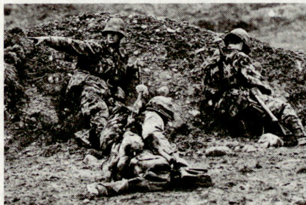
Bild 1. Führen als zielgerichtetes Entscheiden und Durchsetzen und Zyklus der Führung haben in Wirtschaft und Armee viele Gemeinsamkeiten.

Wenn Führen das zielgerichtete Entscheiden und Durchsetzen ist, also das Erreichen von Zielen durch andere, wenn der Zyklus der Führung im wesentlichen aus Entscheidungsvorbereitung, Entscheidung, Auftrag und Überwachung besteht, so sind das alles vollendete Gemeinsamkeiten jeglicher Führung . Ob wir bei der Entscheidungsvorbereitung, bei Analyse und Synthese anstelle der Produktions- und Betriebsmittel der Unternehmung die Kampfmittel der Truppe, statt der Konkurrenz den Gegner und anstelle des Marktes die Umwelt nehmen, so sind dies nicht entscheidende Unterschiede.