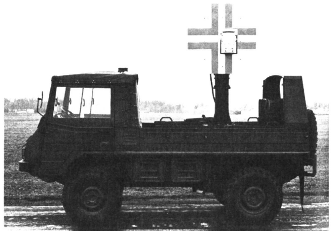
Bild 2. Zielfahrzeug mit Infrarotsender.