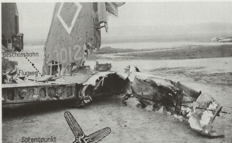
Bild 3. Treffer eines 7,5-cm-Flab-Geschosses im linken Höhensteuer einer «Fliegenden Festung».

richtung Sargans-Calanda, Flughöhe etwa 4000 m (Bild 2).