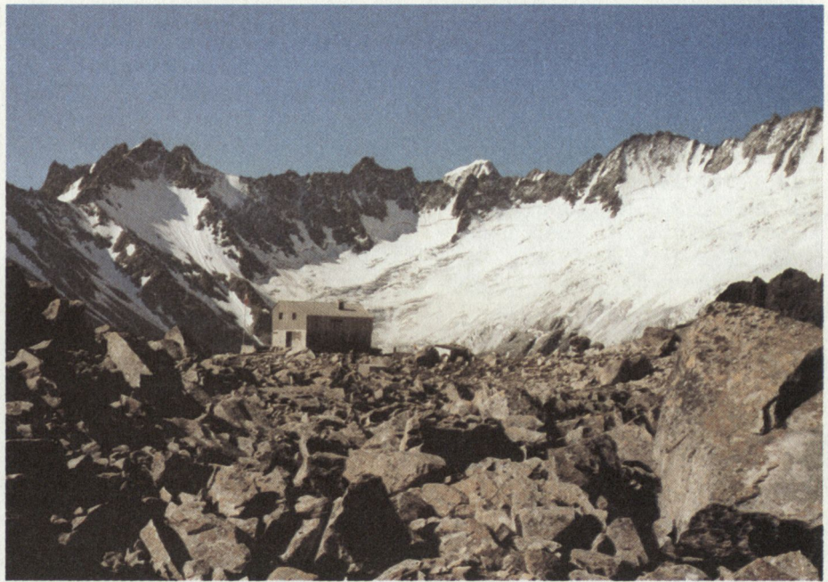
Ausbildungsraum Bergsee-Hütte (Göscheneral)

In der nächsten Zeit wird wohl eine neue Skibindung beschafft (im Versuch), Seilmaterial, Klettermaterial u.a. müssen ergänzt werden.