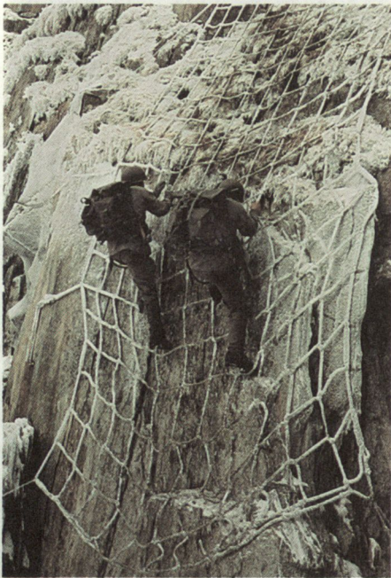
Begeharmachung am Fels

Die Ausbildung der Bergführer erfolgt durch die drei Patentkantone Wallis, Bern und Graubünden unter dem Patronat des Schweizer Alpenclub. Zur Zeit gibt es in unserem Lande zirka 1100 Bergführer, wovon etwa 600 während der Bergsteigersaison regelmässig über längere Zeit führen. In der Armee sind zur Zeit 384 dieser Gebirgsspezialisten als Bergführer eingeteilt (HE - Stabskp des Geb AK 3, Geb Gren Kp und Armeelawinendienst). Die übrigen sind entweder nicht mehr dienstpflchtig (Altersgrenze erreicht) oder wurden aus logischen Gründen in ihren Einheiten belassen. (Geb Füs / S Bat, Seilbahnbataillon u.a.)